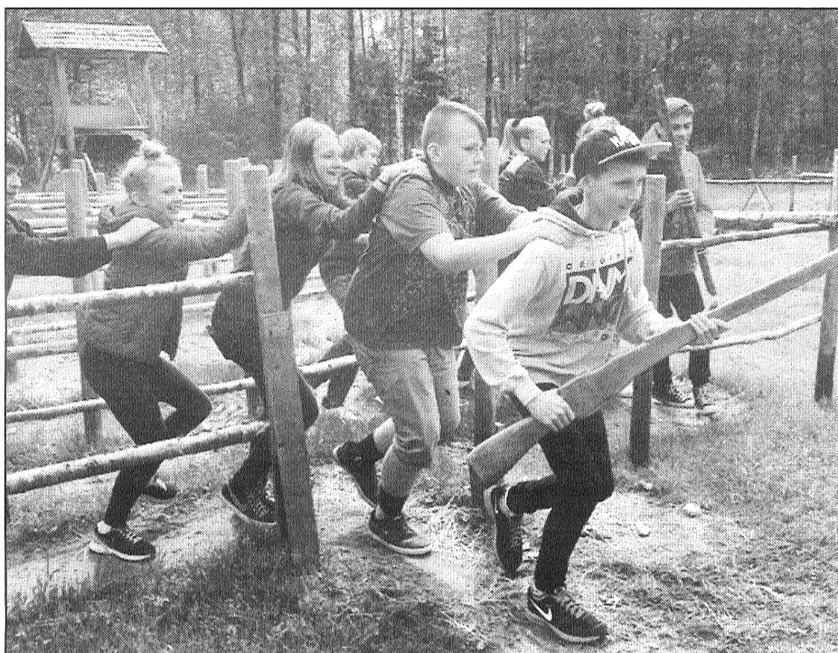
● Veiklības labirints Ziemassvētku kauju muzejā "Mangali".

Ziemassvētku kauju muzejs "Mangali". 1916. gada beigās krievu armijai vajadzēja izlauzties līdz Jelgavai un ne-gaidītais Ziemassvētku nakts uzbrukums