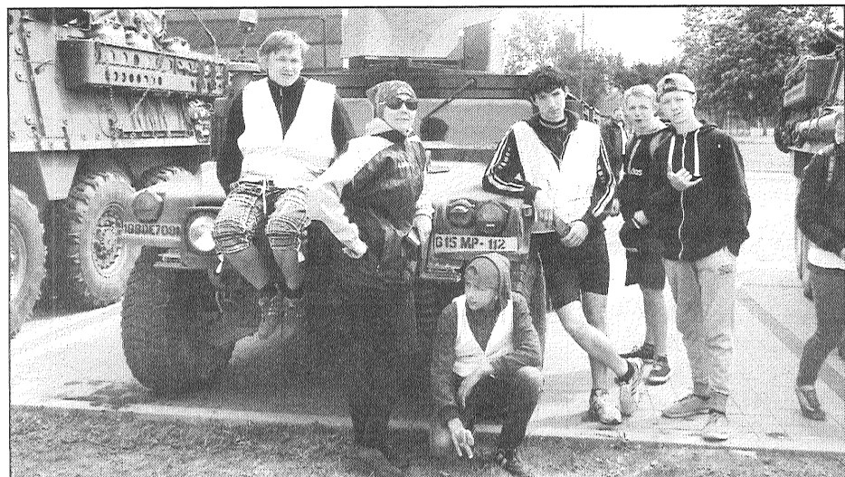
● Jaunsargu vienības velopārgājiena “Apkārt Rāznas ezeram” dalībniekiem paveicās, jo ceļā viņi sastapa Amerikas Savienoto Valstu militāro tehniku mācību marša “Dragoon Raide” laikā.

Pagājušajā nedēļā Jaunsardzes un informācijas centra Jaunsardzes departamenta 2. novada nodaļas 312. Preiļu un Riebiņu jaunsargu vienība devās velopārgājienā. Par 6., 7. un 8. jūnijā notikušo pārgājiena apkārt Rāznas ezeram stāsta jaunsargu instruktors Valērijs Pastars.