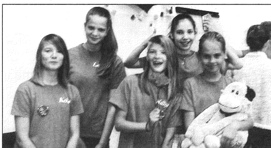
● Uzvarētāji teātra sporta finālturnīrā — 5.-6. klašu komanda.

2. jūnija pašā vakarā, koncertzāles 1. stāva izstāžu galerijā notika oficiālā festivāla atklāšana, kur klātesošos sveica pārstāvji no Liepājas pašvaldības, pilsētas Izglītības pārvaldes, kā arī Valsts izglītības satura centra.