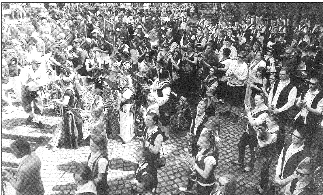
● Koru parka amfiteātri kopkoncertos uzstājās pūtēju orķestri no Latvijas, Polijas un Vācijas. Preiļu jaunie mūziķi (attēlā redzami labajā apakšējā stūrī) parādīja lielisku sagatavotību.

izglītības un zinātnes ministrs Kārlis Šadurskis solījuši, ka skaidrība par mūzikas un mākslas skolu pedagogu algām būs līdz mācību gada beigām, tas ir, 31. maijam, nekādu jaunumu nav arī jūnija vidū.