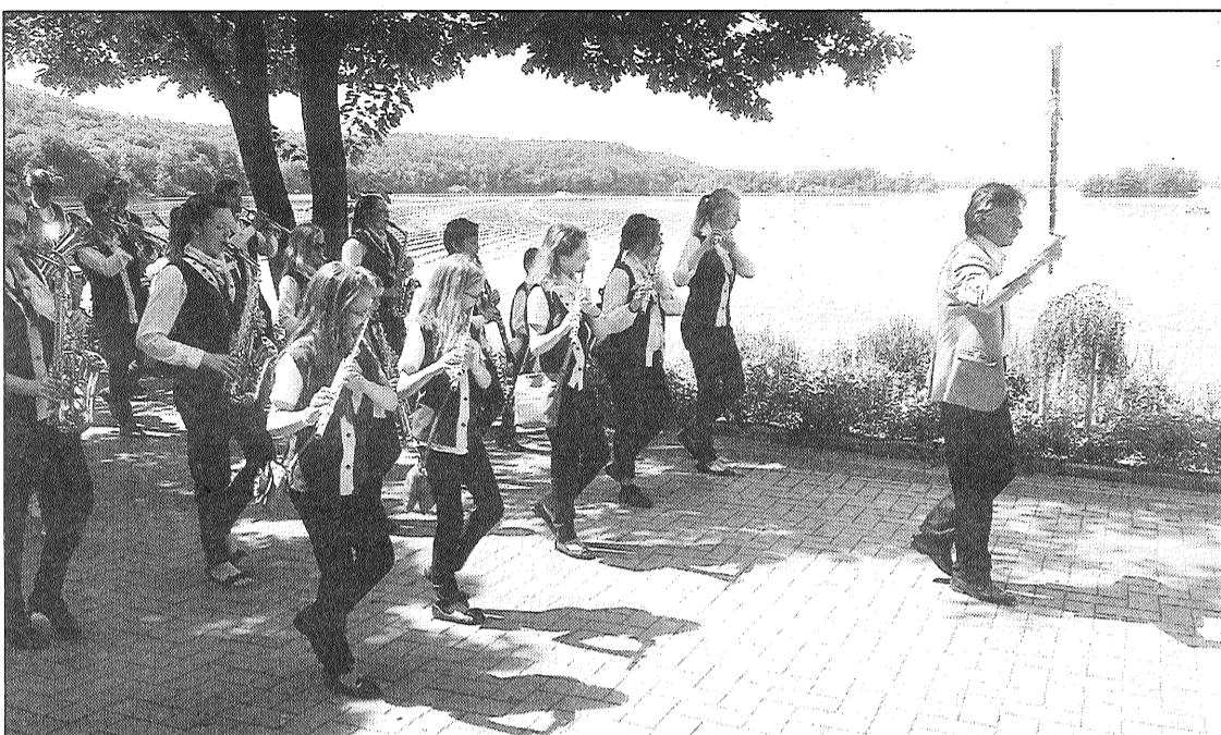
● Preiļu novada kultūras centra jauniešu pūtēju orķestra dalībniekiem katra festivāla diena Vācijas pilsētā Malentē sākās ar gājienu un muzicēšanu pilsētas ielās.