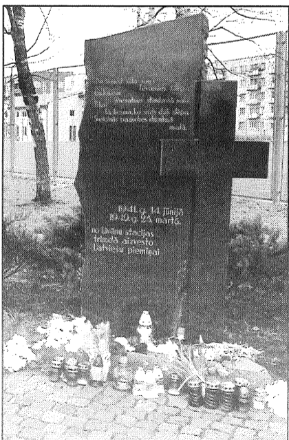
● Piemiņas akmens komunistiskā genocīda upuriem Līvānu dzelzceļa stacijā.