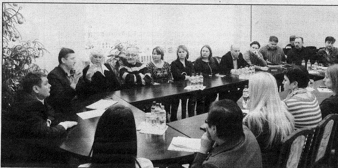
● Kaimiņu novadu tūrisma uzņēmēji vienojušies, ka turpmāk ceļotāju piesaistē darbosies kopā.