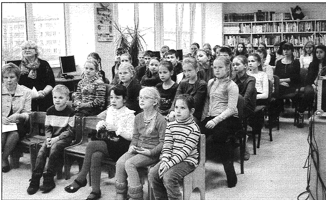
● Bērnu un jauniešu žūrijas 2013 noslēguma pasākuma dalībnieki Preiļu galvenās bibliotēkas bērnu literatūras nodaļā.

Pernā gada maijā lasīšanas un vērtēšanas darbam pieteicās 94 dalībnieki, bet līguma noteikumu līdz galam izpildīja 88 eksperti. Lielākā interese par darbošanos bērnu žūrijā bija 3. — 4. klašu skolēnu grupā, no kuras pieteicās 22 eksperti, un 5. — 7. klašu grupā — 21 eksperts. Visilgāk Bērnu žūrijā darbojas