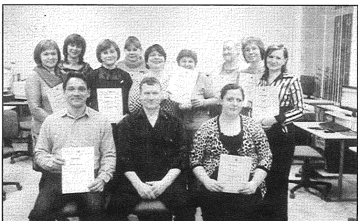
● Novada uzņēmēji pēc datorapmācības kursu noslēguma.