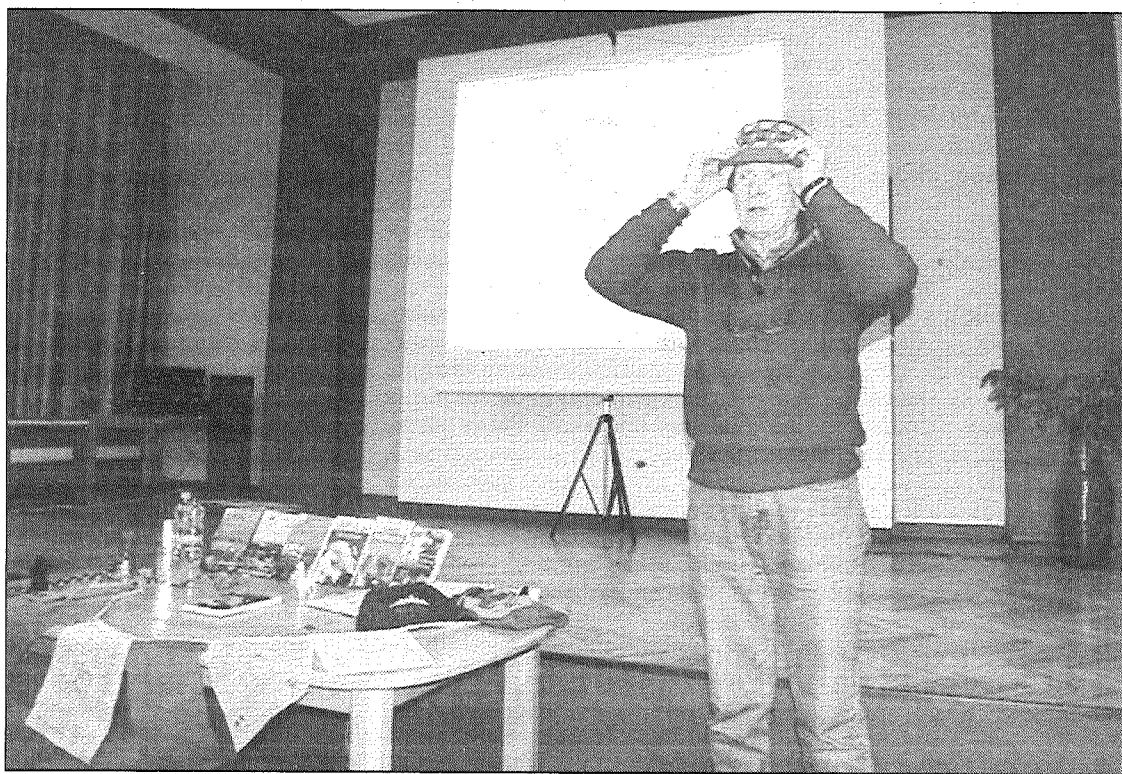
● Pasaules apceļotājs klausītājiem demonstrēja cepuri no kolekcijas, kurā jau ir apmēram 60 galvassegas, no kurām katra raksturo kādas tautas kultūru.

Nomierinošs līdzeklis esot bijis vajadzīgs arī, braucot tā sauktajā «debesu vilcienā», ar kuru no