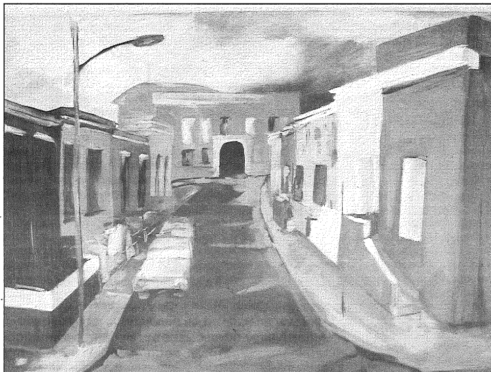
● Jaunie mākslinieki prot saskatīt un parādīt pilsētu izteiksmīgumu.