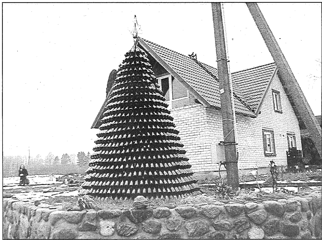
● Stikla egle iespējami iemirdzas, kad tumsā iedegas karkasa vidū un uz pudelēm sakarinātās lampiņu virtenes.

"Man ir ideja uztaisīt vēl kaut ko no pudelēm, bet ne egli," piebilst vīrietis.