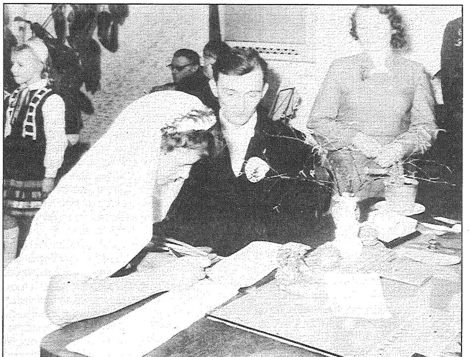
● Miltu ģimenes dzimšanas brīdis — laulības reģistrācijā 1964. gada 1. februārī.