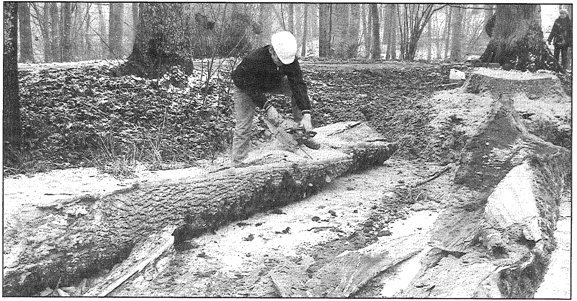
● Tikai pirmajā mirklī šķiet, ka žēl parkā nozāģēto koku. Patiesībā tie ir savu mūžu jau nodzīvojuši — aizlauzti, satrunējušu vidu.

tāja pastāstīja, ka plānots turpināt labiekārtošanu Lielajā salā (pie vecās estrādes). Garenajā salā un gar slēpošanas trasi, kur pašizsējas rezultātā izeauguši vārgi un