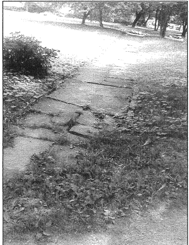
● «Novadnieka» lasītāja iesūtītā fotogrāfija no Celtnieku ielas dzīvojamo namu mikrorajona iekšpagalma. Gājēju ceļiņš patiešām ir sliktā stāvoklī.