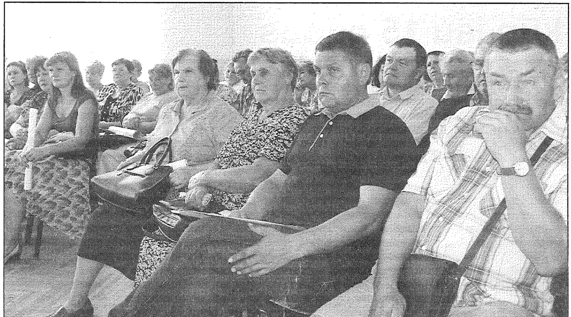
● Āfrikas cūku mēris ir radījis pamatīgu satraukumu. Preiļu novada domes zālē uz tikšanos ar Pārtikas un veterinārā dienesta pārstāvi bija ieradušies aptuveni seši desmiti zemnieku, lauksaimniecības speciālistu un pašvaldību pārstāvju no apkārtnējiem novadiem.

ķinājuši, ka šobrīd Latvijā varētu būt aptuveni 70 tūkstoši mežacūku. Dz.Juškus teic, ka skaitam vajadzētu būt krietni mazākam, īpaši pierobežas mežos. Pārapsūtoība ir viens no iemesliem vīrusa ātrai izplatībai.