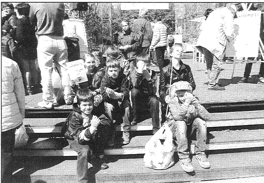
● Vārkavas pamatskolas komanda «Guļbu voga» kartupeļa saņemšanas pasākumā Rīgā.