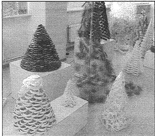
● Ieskats izstādē «Egļu mežā».

Preiļu galvenajā bibliotēkā apmeklētāju uzmanību pašlaik piesaista Daugavpils dizaina un mākslas vidusskolas «Sauls skola» 1. — 4. kursa audzēkņu un pedagogu darbu izstāde «Egļu mežā». Egļu figūras veidotas no visdažādākajiem materiāliem.