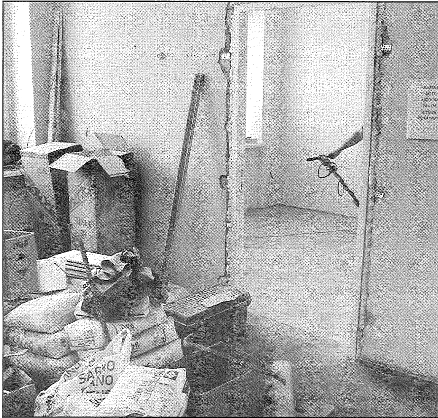
● Poliklīnikas trešajā stāvā pacientiem un mediķiem nākas sadzīvot ar celtniekiem, kuri veic ģimenes ārstu prakšu vietu remontu. Lai pacienti neapjuktu šajā «radošajā» nekārtībā, dakteri pie saviem kabinetiem atstājuši ziņas, kur viņus meklēt.

darbi jāpabeidz tuvāko mēnešu laikā. Pašlaik būvnieki — pilnsabiedrība «A.A. & Būvkompanijas» — veic cokola un fasādes siltināšanu, kā arī jumta seguma nomaiņu. KPMI projektus administrē valsts, stāsta Z.Erts, tā ir nauda, ko valsts iegūst no pārdotajām emisiju kvotām. Termiņi ir visai sastringti, darbus nākas veikt arī ziemas