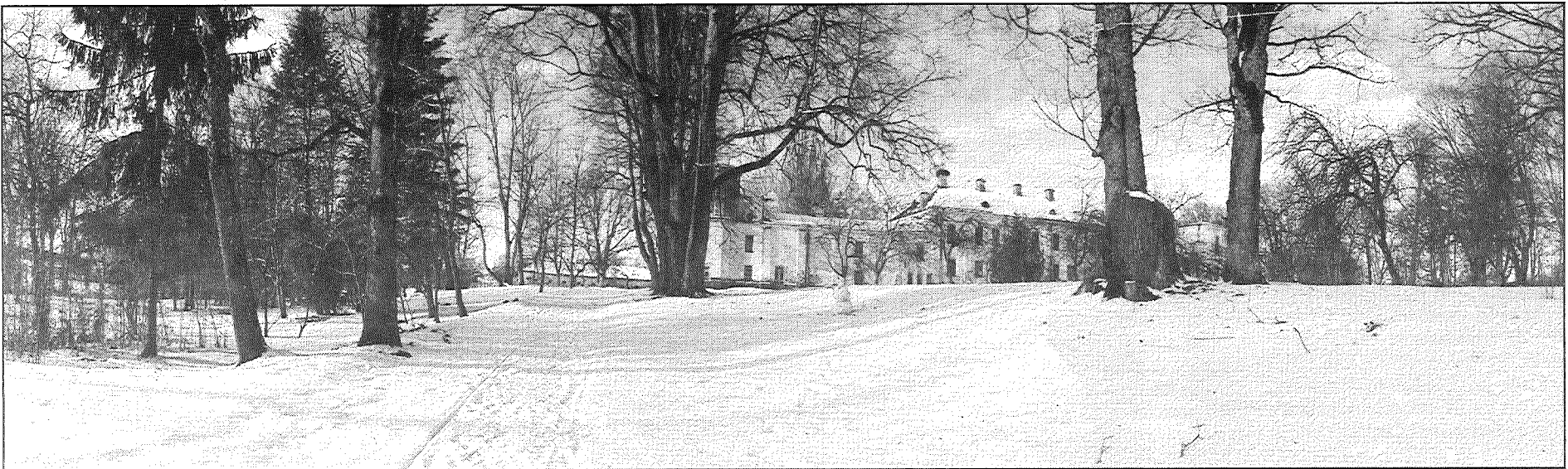
● 2. vieta — autore Līga Pauniņa.