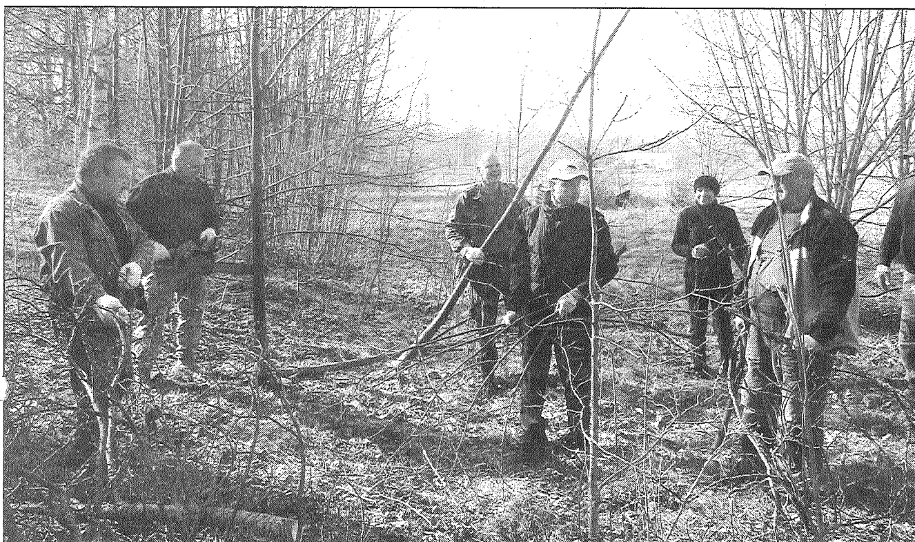
● Zemessardzes 35. nodrošinājuma bataljons izcirta mazvērtīgos pašsējas kokus Preiļu parka teritorijā starp Mehanizatoru un Daugavpils ielu.

25. aprīlī visā Latvijā notika Lielā talka. Tās mērķis, lai 2018. gadā, savā simtgadē, Latvija būtu zaļākā valsts pasaulē. Preiļu novada iedzīvotāji talkā piedalījās astoto reizi. Par rezultātiem informē SIA "Preiļu saimnieks" sabiedrisko attiecību speciāliste Inese Šņepste.