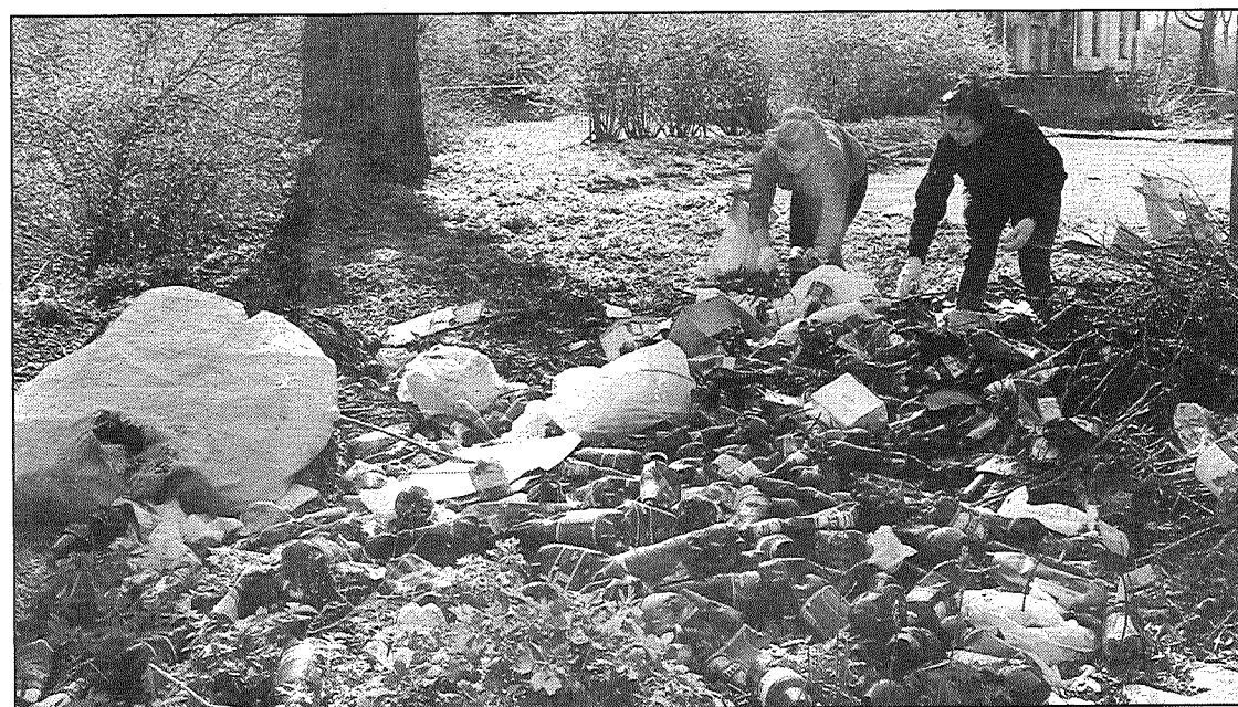
● Talciniekiem pie Riebiņu muižas nācās savākt plastmasas pudeļu kaudzi, ko kāds, acimredzot, atvedis un izgāzis.

Un tomēr paldies jāsaka visiem tiem entuziastiem, labprātīgajiem un aktīvajiem novada iedzīvotājiem – talciniekiem, organizētājiem un atbildīgajiem. SIA "Ekolatgale" jau tās pašas dienas pievakarē visus novadā savāktos atkritumu maisus nogādāja Dienvidlatgales reģiona atkritumu noglabāšanas poligonā.