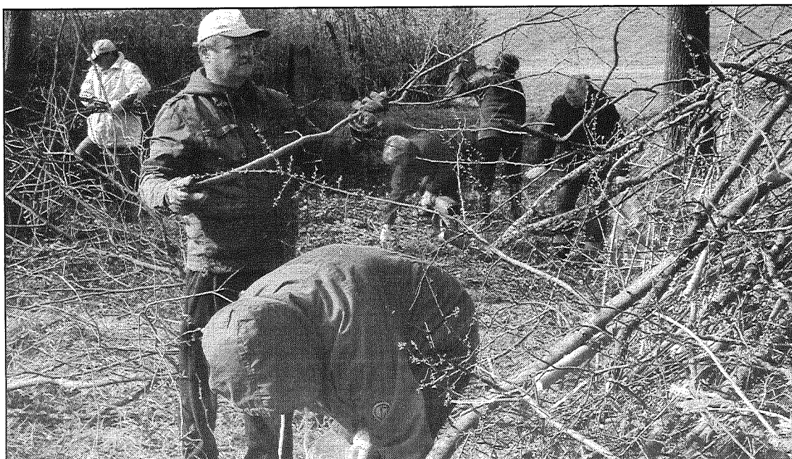
● Talkas laikā livānieši izcirta arī krūmus.

Pirmsskolas izglītības iestādes "Rūķi" audzēkņi un darbinieki piedalījās par labu tradīciju kļuvušajā "čiekuru talkā", savācot 14 maisus ar čiekuriem (bērnu dārza teritorijā ir priežu mežs). Livānu novada domes darbinieki un viņu ģimenes locekļi sakopa Dubnas upes krastu starp abiem tiltiem, kur nākotnē pašvaldībai ir iecere izveidot atpūtas vietu. Talkoja arī Livānu novada uzņēmumu un pašvaldības iestāžu darbinieki, kā arī iedzīvotāju iniciatīvas grupas. Sakoptas vairākas Livānu pilsētas ielas, ezeru apkārtnes, kapsētas, mežu teritorijas.