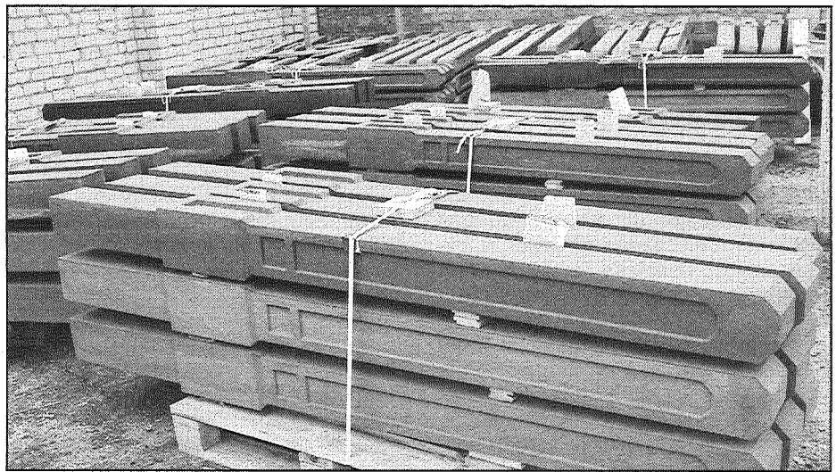
● Gatavā produkcija gaida pircējus.

neizdevīgi, ja nepieciešams mazāks daudzums.