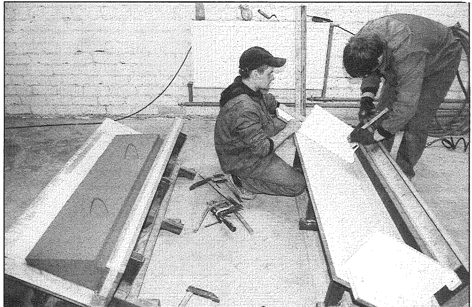
● Nepieciešama uzmanība un rūpība, lai betona izstrādājums būtu kvalitatīvs.

Lai gan pagaidām SIA "SBR" ir samērā jauna ražotne, vietējās būvfirmas to jau pazīst. Lielākās betona izstrādājumu ražotnes koncentrējas reģionā ap Rīgu, un, lai to izstrādājumu atvestu uz Latgali, transporta izdevumi ir ievērojami, kas sevišķi