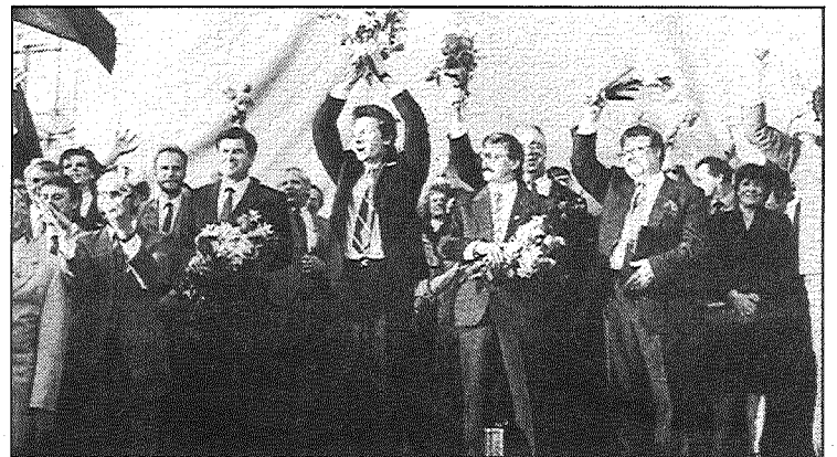
● LR AP deputāti tautas manifestācijā pēc Neatkarības deklarācijas pieņemšanas Rīgā, Komjaunatnes (tagad — 11. novembra krastmalā). (Foto no interneta)

Izmantota Latvijas Zinātņu akadēmijas sagatavotā grāmata «4. maijs Rakstu, atmiņu un dokumentu krājums par Neatkarības deklarāciju»