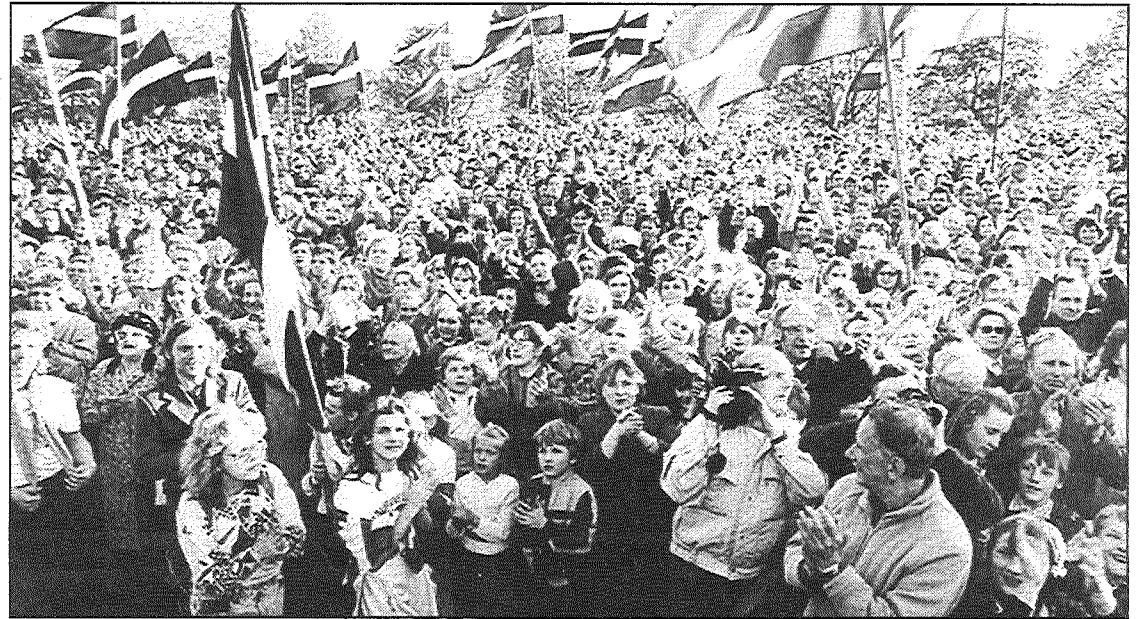
● Latvijas tauta ar sajūsmu atbalstīja valsts neatkarību.