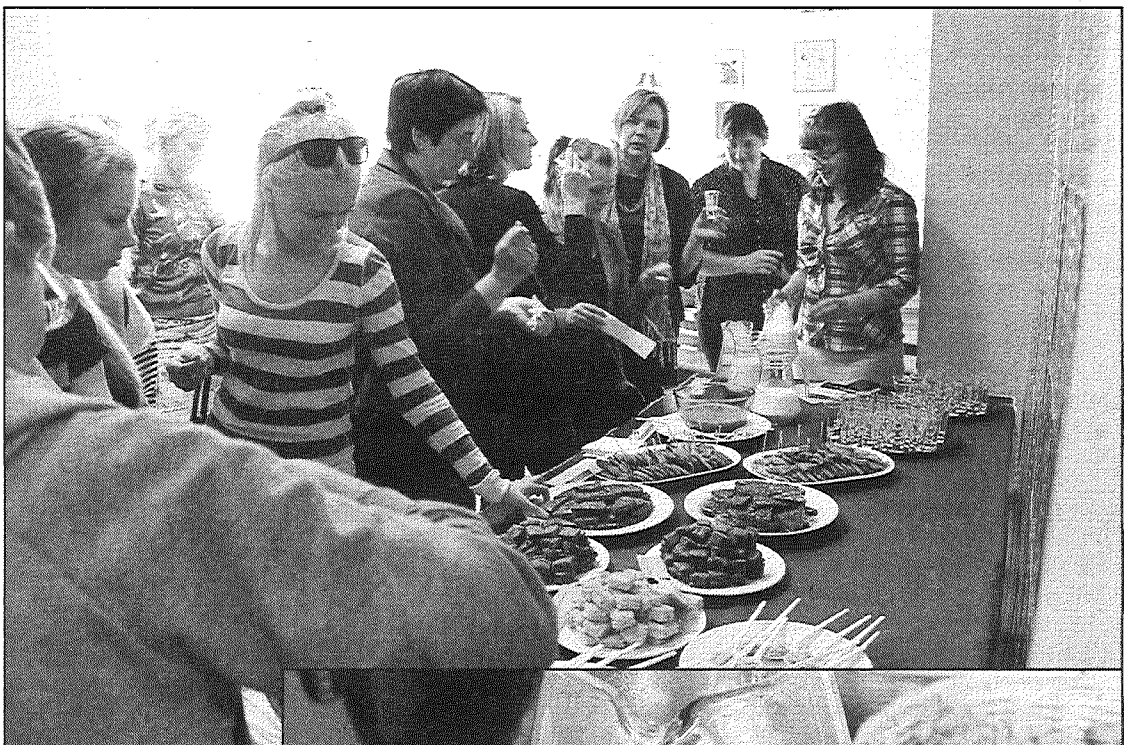
● Diskusijas un degustācijas dalībniekiem bija liela interese par drošu pārtiku bez alergēniem.

Eiropas Parlamenta Informācijas birojs skaidro, ka Eiropas Parlamenta deputāti ir neatlaidīgi iestājušies par pārtikas nekaitīgumu, patērētāju informēšanu un dzīvnieku labturību. Pērn stājās spēkā Eiropas Parlamenta un Padomes Regula, kas uzliek par pienākumu visiem Eiropas Savienības pārtikas ražotājiem obligāti norādīt alergēnus produktu marķējumā. Jaunie noteikumi tāpat paredz, ka informācija par alergēniem jānorāda arī nefasētiem produktiem, piemēram, pārtikai, ko piedāvā restorānos vai ēdnīcās.