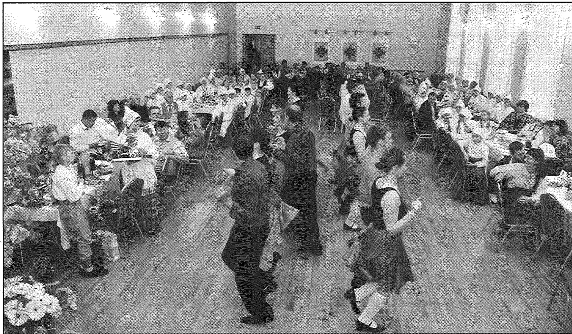
● Jubilārus sveic Vanagu vidējās paaudzes tautas deju kopa.