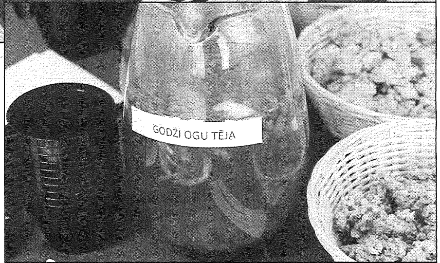
● Godži ogu tēju daudzi vēl nebija baudījuši, bet atzina par lielisku.