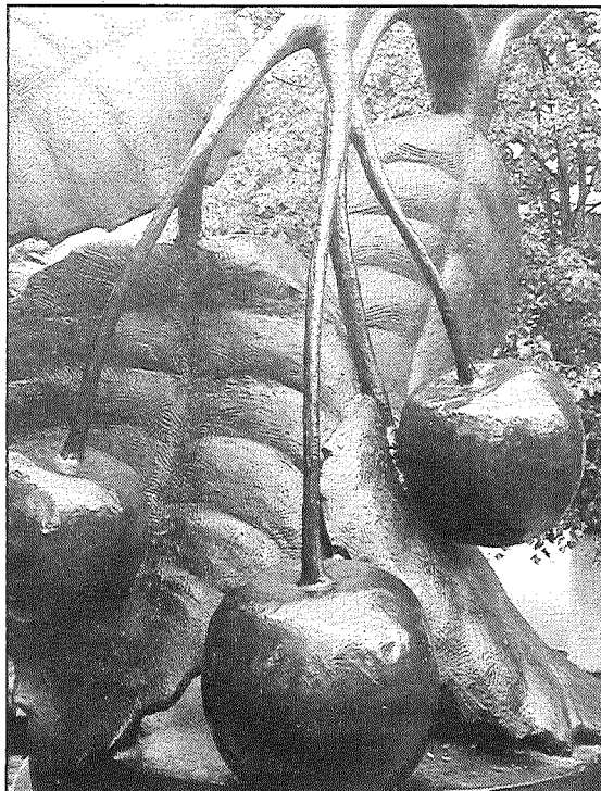
● Glubokoje iedzīvotāji tik ļoti lepojas ar saviem ķiršu dārzkiem, ka šim augļu kokam uzstādījuši pieminekli.