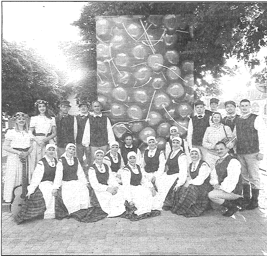
● Preiļu novada kultūras centra deju kopa "Talderi".

Savukārt Preiļu novada sadraudzības pilsētas svētkos pārstāvēja Preiļu novada kultūras centra deju kopa "Talderi" un ģitāristu duets. Deju kopas