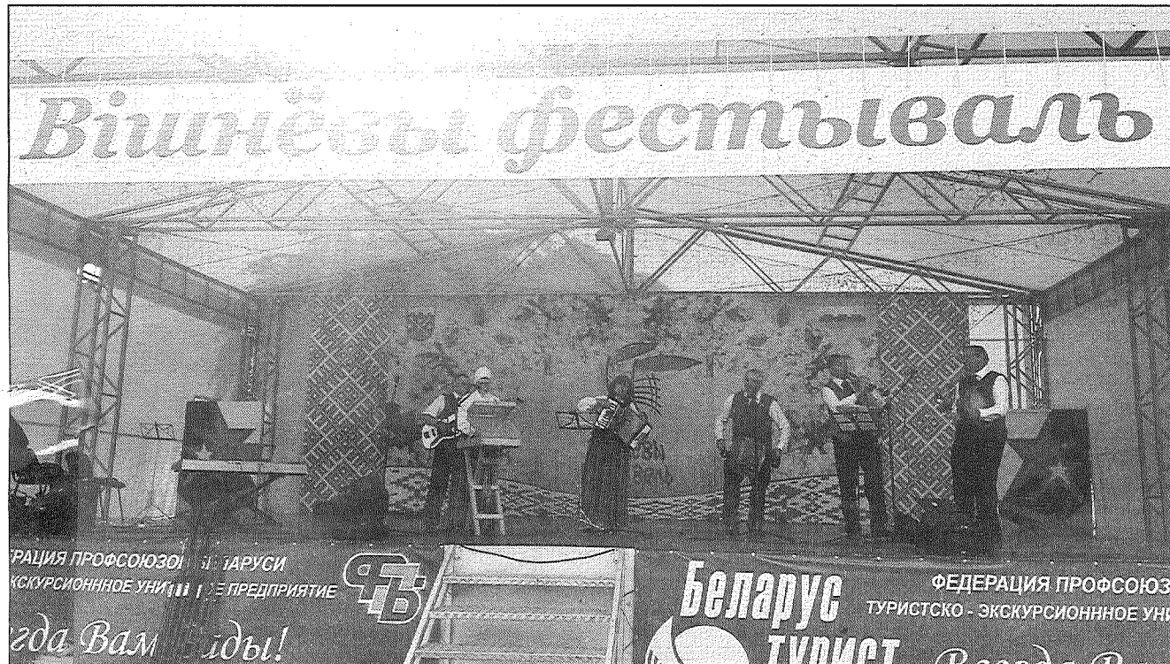
● Riebiņu novada kapela "Nu i raun" muzicē Ķiršu festivāla noslēguma koncertā Baltkrievijas pilsētā Glubokoje.

Pagājušās nedēļas nogalē, 17. un 18. jūlijā, Baltkrievijas pilsētā Glubokoje notika starptautiskais investīciju forums "Glubokoje Invest". Foruma mērķis — veicināt labvēlīgas investīciju vides attīstību un kontaktu veidošanos foruma dalībnieku vidū. Gan investīciju forumu, gan tradicionālo Ķiršu festivālu sadraudzības pilsētā apmeklēja arī Riebiņu un Preiļu novada domju pārstāvji, kā arī vairāki pašdarbības kolektīvi, kas uzstājās koncertos.