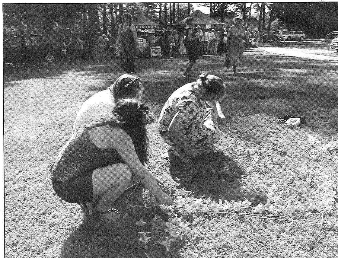
● Top ziedu kompozīcijas.