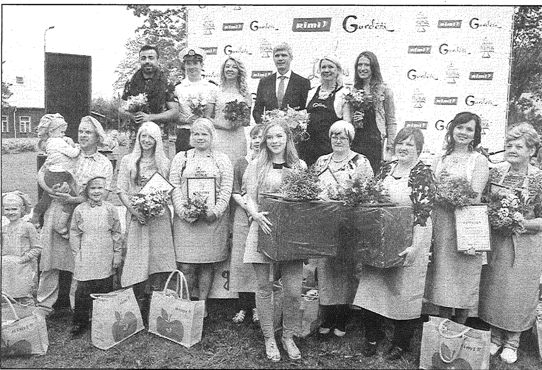
● Konkursa «Latvijas gardākā kūka» Latgales reģiona pusfināla noslēgumā.

Jau izsenis Latgales saimnieces tiek daudzīnātas kā prasmiņas garšīgu ēdienu gatavotājas. Agrāk lielākie godi nebija iedomājami bez saimnieces paaicināšanas, kura gan galdu saklāja, gan viesus pārsteidza ar savu meistarību, ceļot galdā kulinārijas šedevrus. Tagad laiki mainījušies: veikal plaukti vai lūst no produktu pārpilnības un visu var gatavu nopirkt. Taču saimnieču zināšanas nekur jau nepazūd: tās vecmāmiņa nodod mazmeitai, māte — meitai, tās tiek pierakstītas burtnīcās un noder citiem.