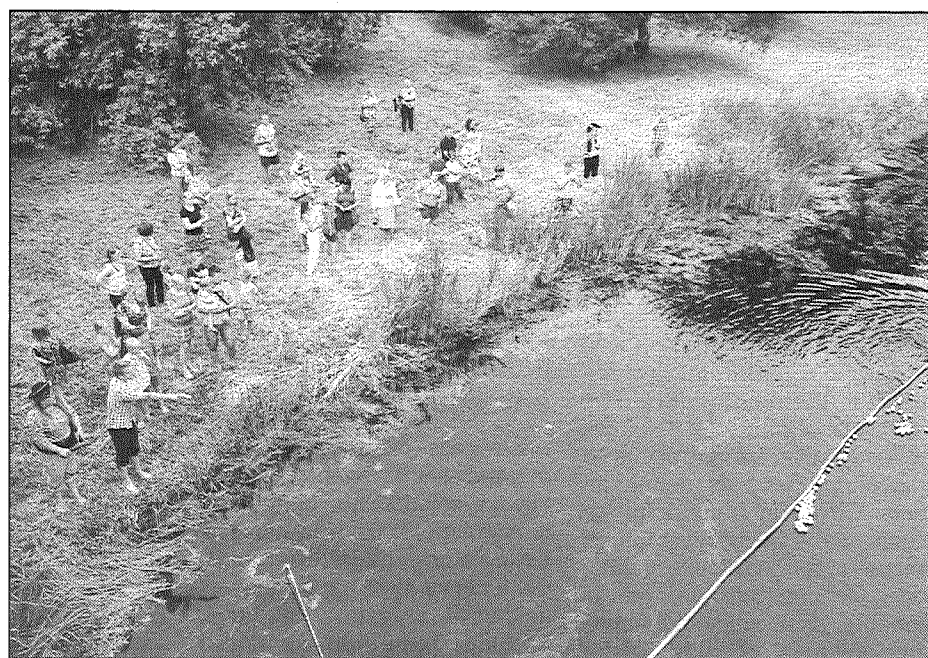
● Labdarības bumbu rallijs.