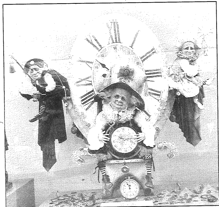
● Mākslas galerijā var apskatīt labākos portreta, buduāra, ironisko leļļu tēlus, kā arī industriālo Steampunk pilsētīņu, kas neatstāj vienaldzīgu nevienu apmeklētāju. Katra lelle ir izgatavota tikai vienā eksemplārā un iepriecina ar savu neatkārtojāmību. Mākslas galerija “Vladlena” atrodas Rīgā, Vaļņu ielā 19 (ieeja no Gleznatāju ielas).