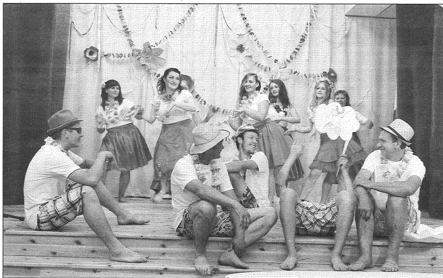
● Vārkavieši izklaidējas «Hawaii» stilā.