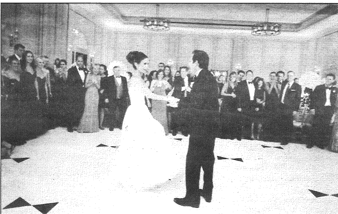
● Līdz šim Vendijas mīlākās kāzas ir bijušas Salamandera Kūrtā, Virdžīnijā, uz kurām pāris uzaicināja 300 viesus.

zainu, kā arī praktizēties dažādās pasaules valstīs, lai atrastu vispiemērotāko nišu, kurā veidot savu biznesu.