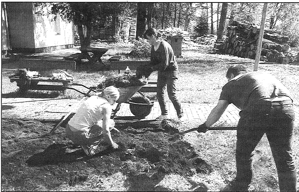
● Rit sociālās dzīvojamās mājas „Rudenāji” apkārtnes labiekārtošana.

Galēnu pagasta iniciatīvas grupa „Kopā ir spēks” ar Riebiņu novada domes atbalstu īsteno projektu „Sociālās dzīvojamās mājas „Rudenāji” apkārtējās vides labiekārtošana”. Projekta mērķis ir labiekārtot sociālās dzīvojamās mājas „Rudenāji” apkārtējo vidi, tādējādi to aizsargājot, uzlabojot tās iemītnieku labsajūtu un radot viņiem mājas sajūtu.