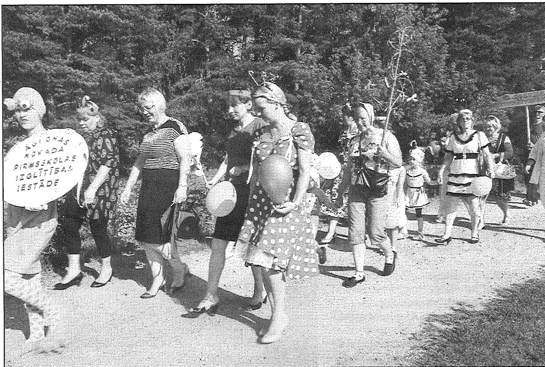
● Svētku gājienā — Aglonas novada pirmskolas izglītības iestādes darbinieki.