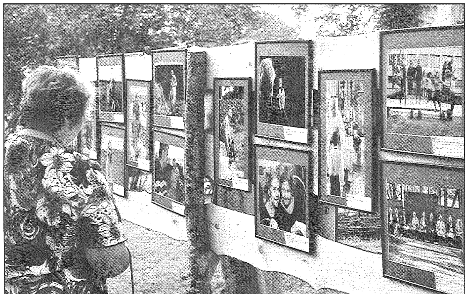
● Lielu interesi izraisīja pašmāju fotogrāfu darbu izstāde.

Ar daudzveidīgu programmu aizvadīti VĀRKAVAS novada svētki, kas aizsākās 31. jūlijā, kad izskanēja novada amatierkopu koncerts «Hawaii» stilā. Novada dejojošie, dziedāošie un teātri spēlējošie kolektīvi rādīja savu māku un izdomu, iejūtoties karsto tropu iedzīvotāju tēlos. Darbojās arī «Foto Box», kur varēja nofotografēties atbilstoši pasākuma tēmai. Koncerts ritēja Vārkavas tautas namā. 1. augustā Vārkavas vidusskolas stadionā notika sporta svētki, kas ik gadus risinās novada svētku ietvaros. Notika sacensības volejbolā, strībolā, savu varēšanu demonstrēja gan lieli, gan mazi spēkavīri. Tajā pašā dienā Rožkalnos risinājās deju festivāls «Lai katrs mirklis gaismas piepildīts, mīlestības ieskauts un sasildīts», kurā piedalījās gan novada dejojotāji, gan arī pašdarbības kopas no Līvāniem, Višķiem un tālākām vietām.