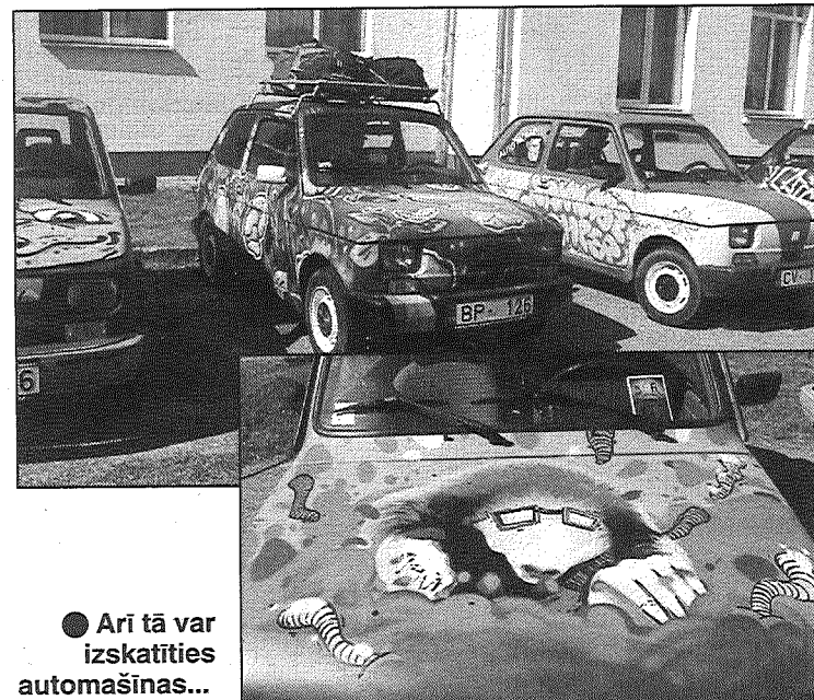
● Arī tā var izskatīties automašīnas...