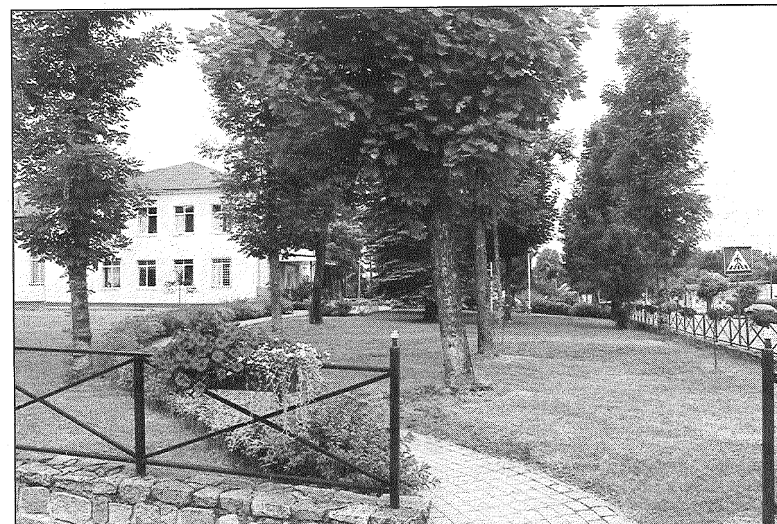
● Aglonas novada domes ēkas apkārtnē ietērpta puķu rotā.