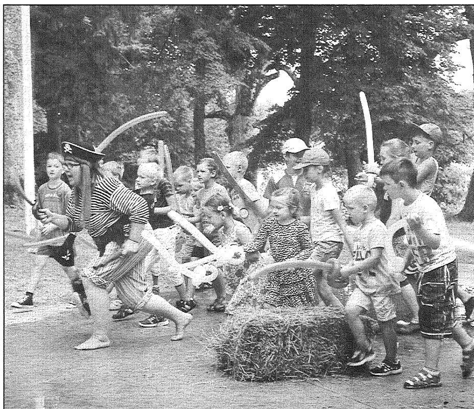
● Bērni pirātu ballītē.