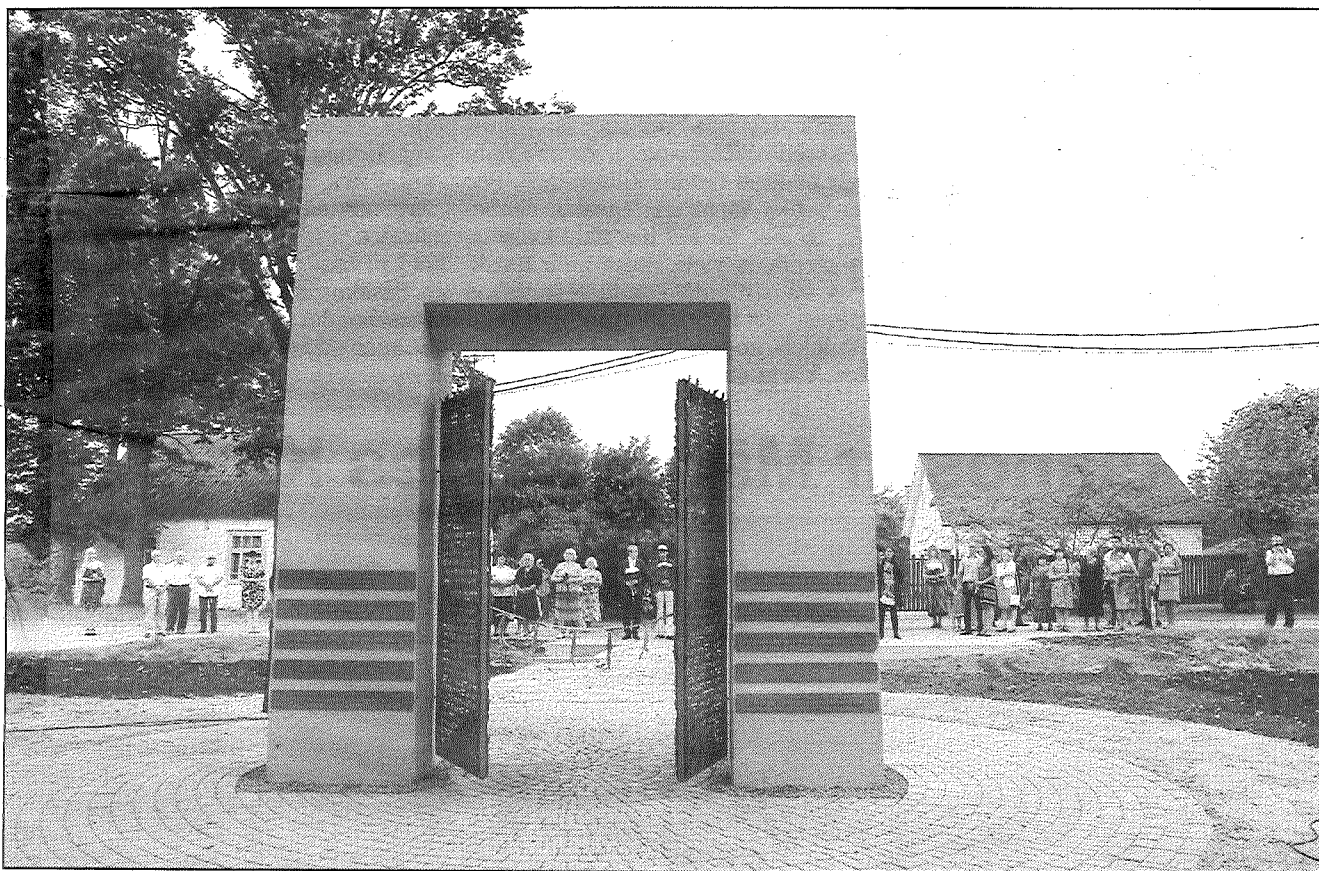
● Jaunatklātā arka — piemineklis ebreju kopienai Preiļos.

9. augustā Preiļos, Cēsu ielā pie ieejas ebreju kapsētā tika atklāts piemineklis cilvēkiem, kuri līdz 1941. gadam bija Preiļu miesta, vēlāk — pilsētas un Preiļu pagasta sociālekonomiskās dzīves neatņemama daļa, cilvēkiem, kuri aktīvi piedalījās pilsētas dzīvē, darbojās pašvaldības valdē, — ebrejiem. Vēl 1935. gadā viņi sastādīja vairāk nekā pusi no kopējā Preiļu iedzīvotāju skaita.