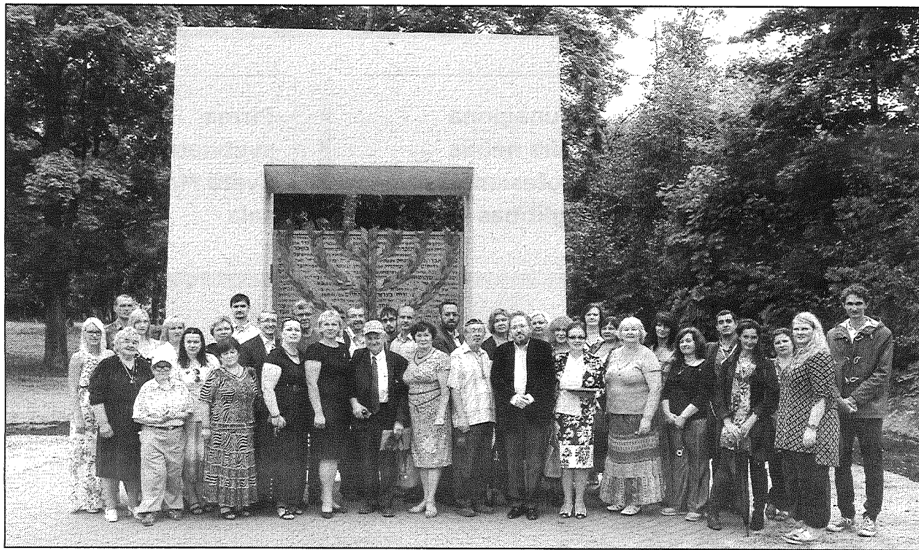
● Pieminēkļa ebreju kopienai atklāšanas un holokausta upuru piemiņas pasākuma dalībnieki.