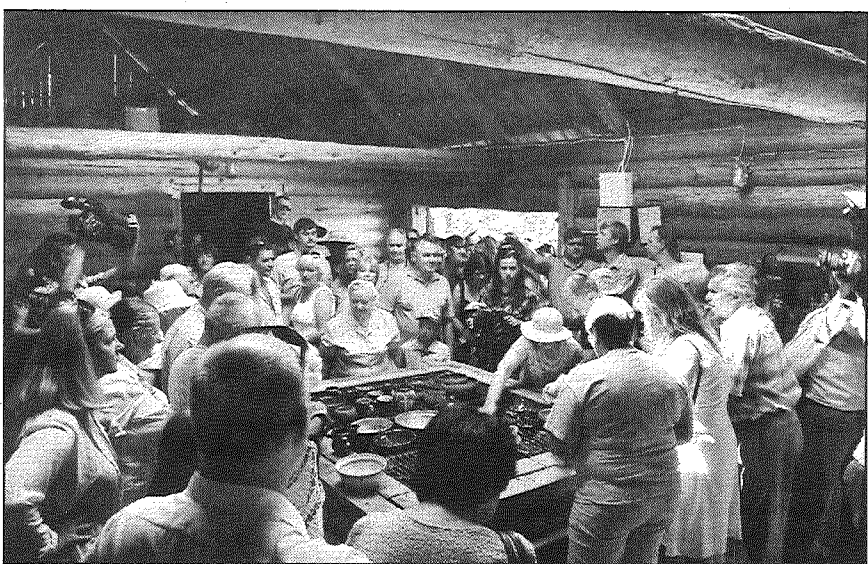
● Keramikas ceplja ar svaigi apdedzinātiem podiem atvēršana piesaistīja daudzu interesentu uzmanību.