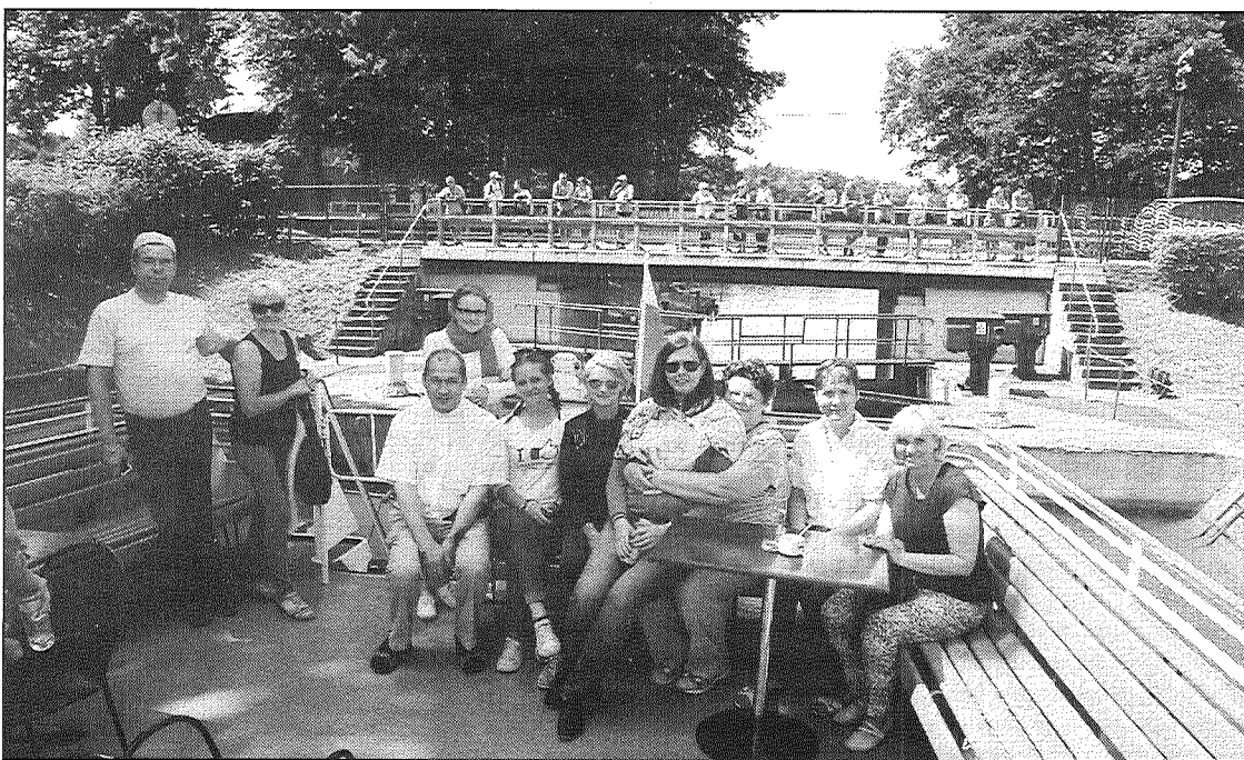
● Viens no ceļojuma jaukākajiem notikumiem – brauciens ar kuģi pa Mazūru ezeriem. Kādreiz te smaiļojis bīskaps Karols Voitila – vēlākais pāvests Jānis Pāvils II.

notikums – ceļojums ar kuģi pa Mazūru ezeriem. Kādreiz pa šiem ezeriem ar smailīti brīvajā laikā airējās priesteris, tad bīskaps Karols Voitila – tagadējais svētais Jānis Pāvils II. Svētceļniekiem došanās ar ūdens transportu no Mikolajkiem un Ru-ciane – Nīdu atgādināja Jēzus ceļojumu kopā ar