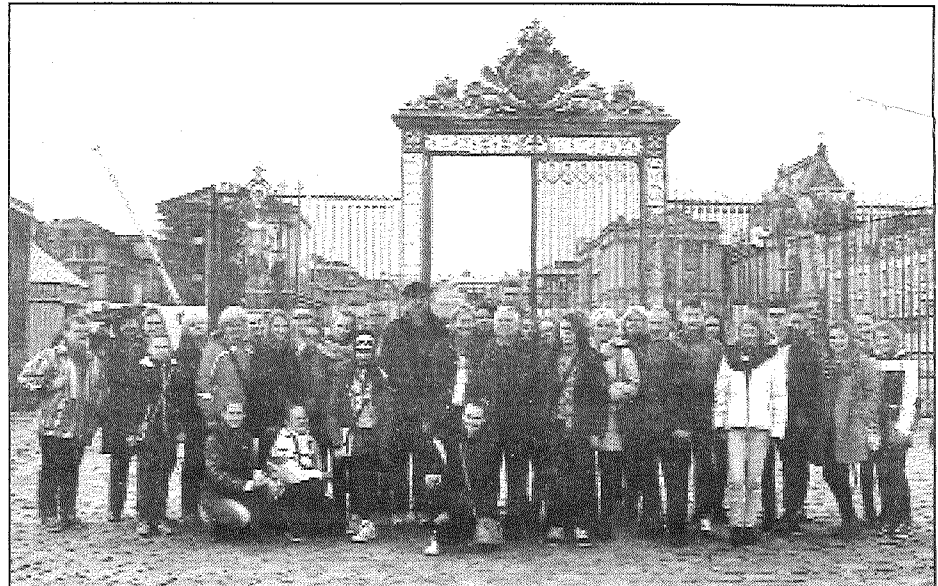
● Parīze ir kā mākslas darbs, ko veido cilvēki, arhitektūra, daba un atmosfēra — šim secinājumam piekrīt mācību ekskursijas dalībnieki no Preiļu mūzikas un mākslas skolas