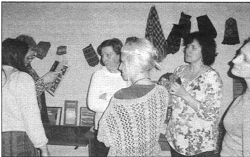
● Uz papīra pārzīmētie Stabulnieku pagasta adītāju cimdu raksti neaizies nebūtībā, projekta dalībnieki tos saglabās nākamajām paaudzēm.

26. novembrī notika projekta noslēguma pasākums „Savam pagastam”, kurā projekta dalībnieki atskatījās uz paveikto un vienotās par tālākajiem darbības virzieniem. Pasākuma laikā tika izteiktas pateicības autoriem, kuri savus darbus bija atnesuši izstādei, un bērniem, kuri bija ieinteresēti visās