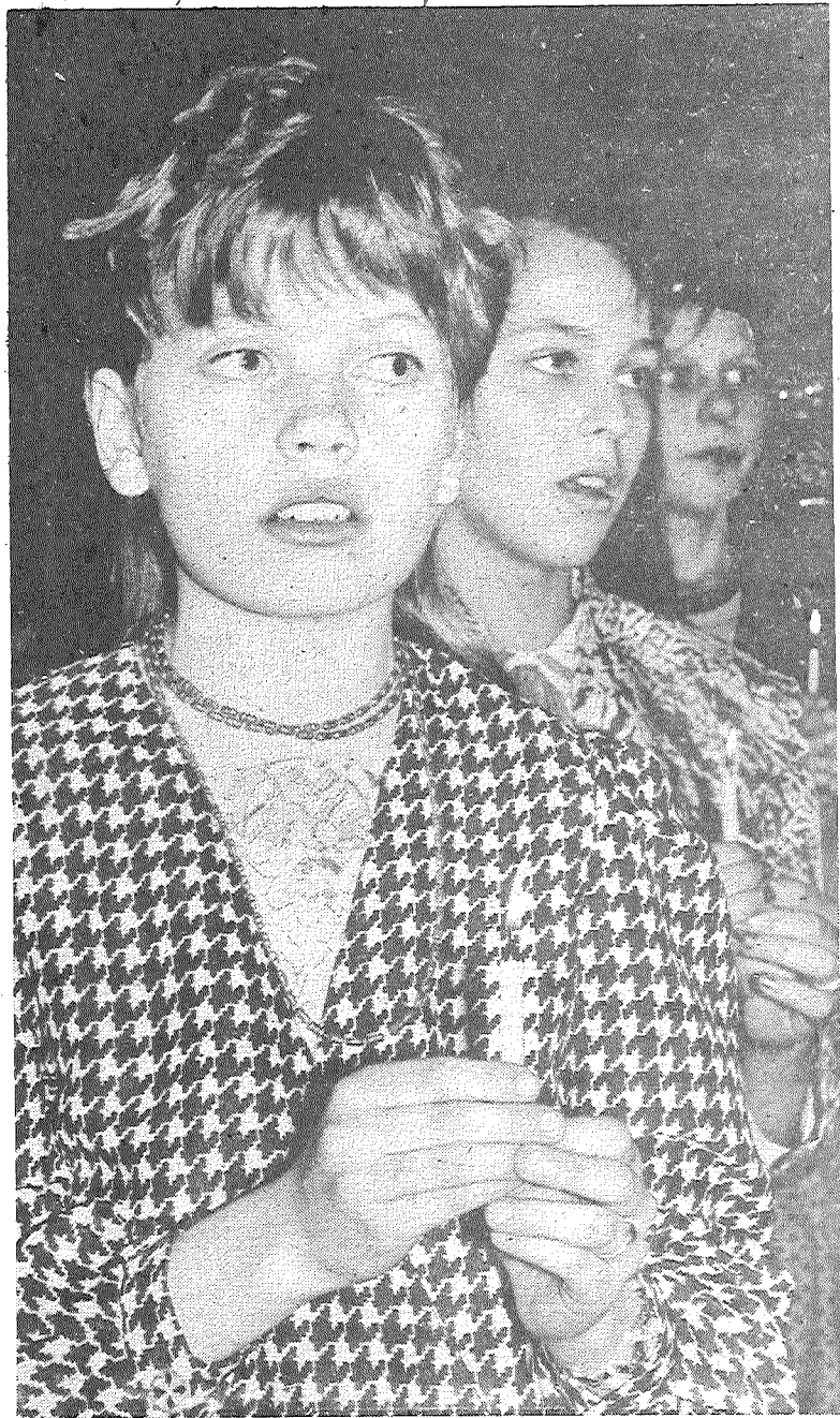
■ Sveču liesmas, Ziemassvētku dziesmas mazās sirdīs ieliksmo.