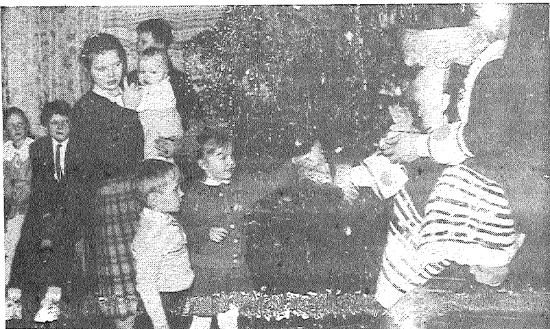
■ Ziemassvētku vecitīm dāvanas gan lielajiem, gan pavisam maziem bērniem.

Pie mazajiem Smelteru iedzīvotājiem Gailis kopā ar citiem dzīvniekiem un Salavcīti atnāca divdesmit astotajā decembrī, kad krāšņi uzpostajā Salas pamatskolā dedzināja eglīti. Plašu un daudzpusīgu svētku koncertprogrammu bija sagatavojuši skolēni savu klašu audzinātāju vadībā. Šeit dziesmas mijās ar dejām un skečiem un, protams, neizpalika