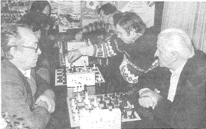
■ Spele galda tenisistū un šahisti.