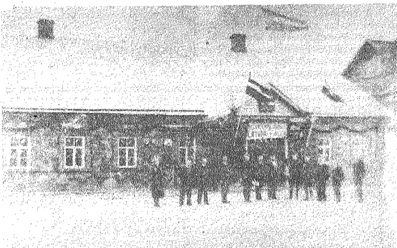
■ Preiļu pagasta valdes ēka 1935. gada 16. maijā.