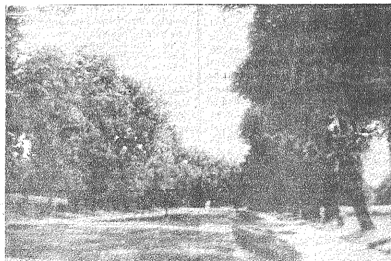
■ Liepu iela 30. gados.