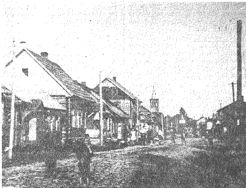
■ Sondoru iela Preiļos 30. gados.