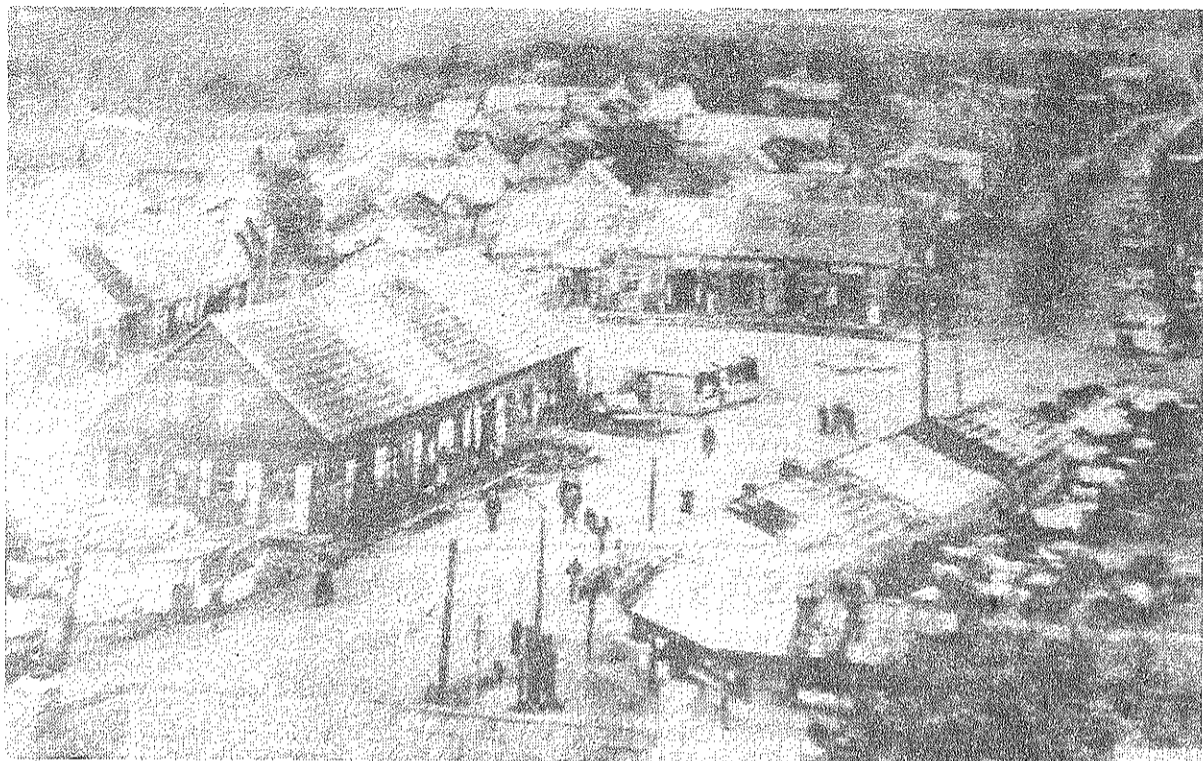
■ Preiļu pilsētas centrs 30. gados.