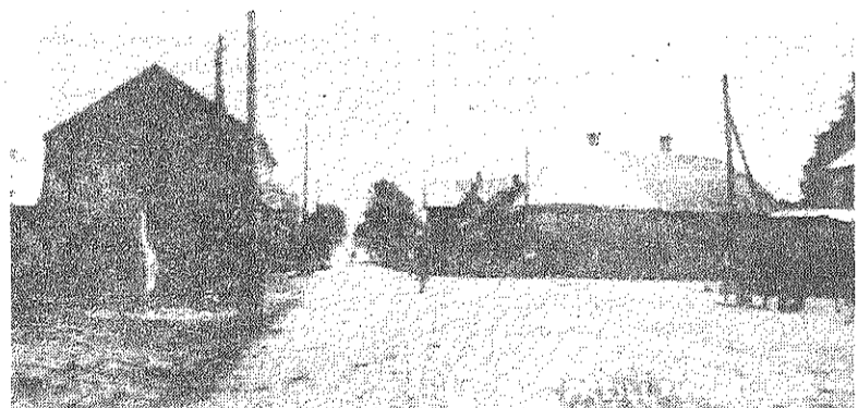
■ Rušonas iela Preiļos 30. gados.