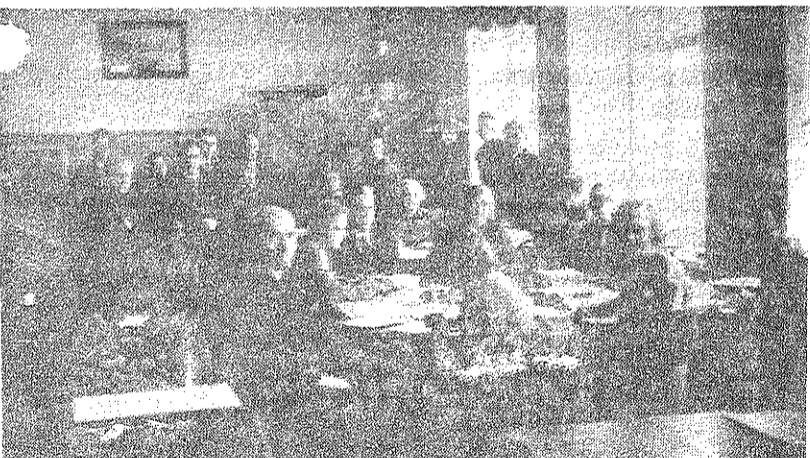
■ Preiļu pagasta valdes locekļi.