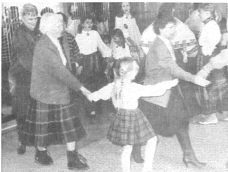
■ «Pasaciņas» bērni izdancināja arī ciemiņus no Zviedrijas.

Cienījamie «Novadnieka» lasītāji, kas pasūtījuši mūsu avīzi tikai pirmajiem trim šī gada mēnešiem!