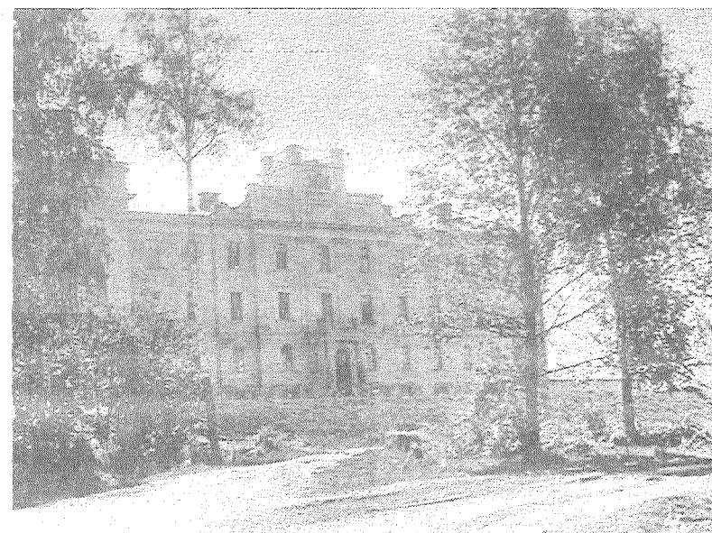
■ Aglonas ģimnāzija 1936. gada 12. septembrī.