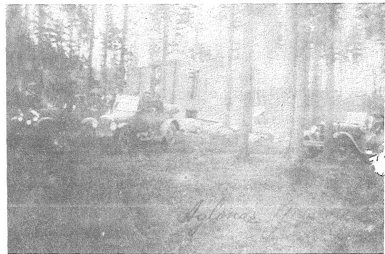
■ Aglonas ģimnāzijas celtniecības sākums 1927. gadā.