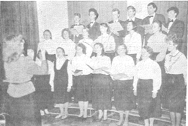
■ Dzied Aglonas bazilikas koris.

Pie Dieva esot, mūsu Broks palīdzēs mums Aglonas sakārtošanā.