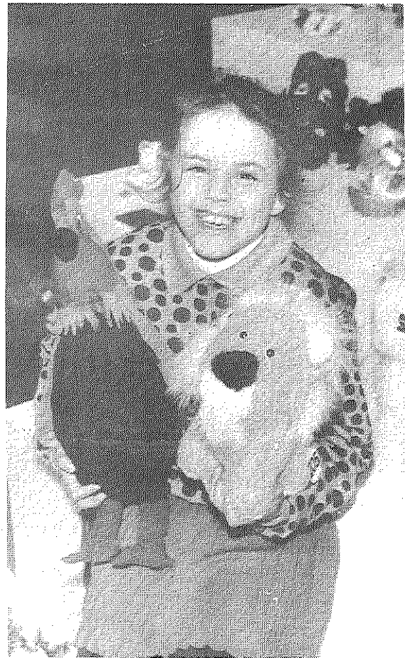
■ Tik mīļi un silti bija paņemt rokā katru rotaļlietu!

Arī sponsori šoreiz bija atsaucīgi. Sevišķi individu-