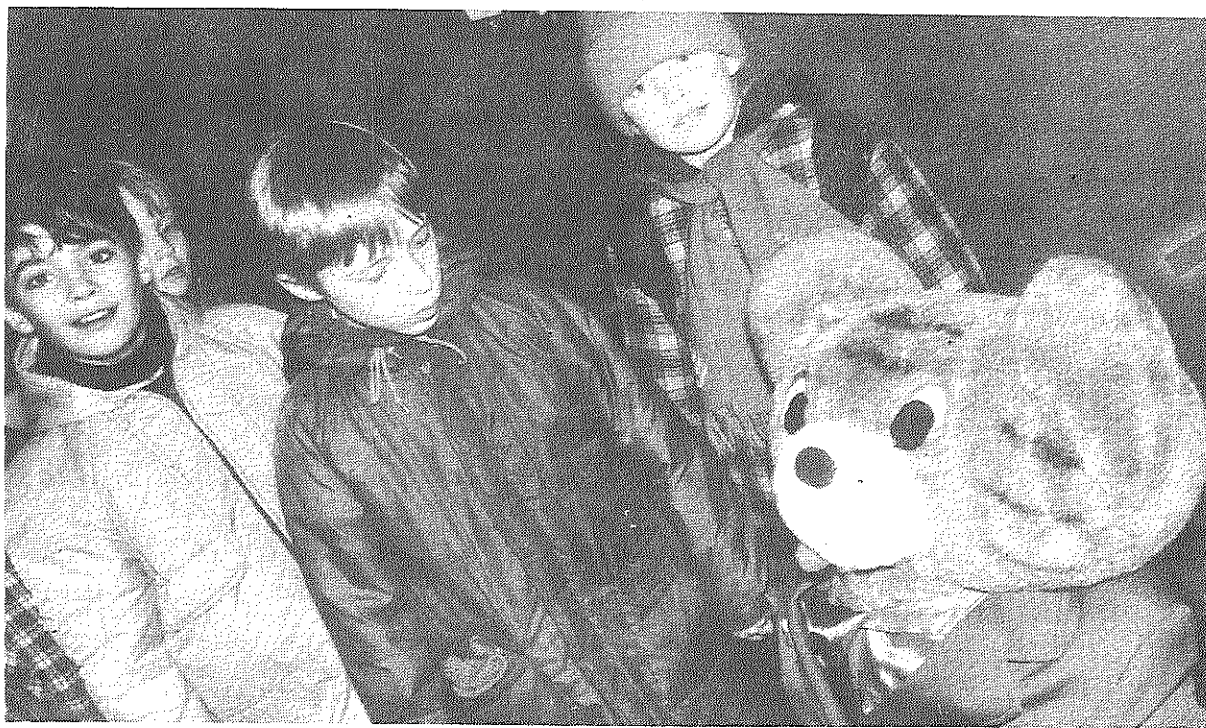
«Izstādes direktoram» bija vislielaka piekrišana, un tiesi viņš vislielaka mera palīdzēja simpatiju balvu saņemt Daugavpils bērniem. Šo lielo, izejamā ancukā tērpto lāci par izstādes direktoru tā cienījamā izskata un blakus esošā telefona dēļ nosauca paši skatītāji.