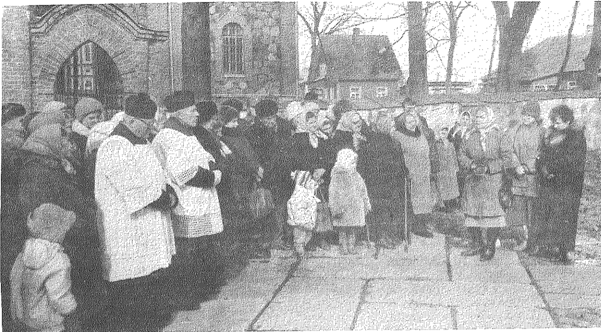
■ Komunistiskā terora upuru piemiņas brīdī Preiļos.

Piemiņas brīdī klātesošie tika lūgti doties uz kultūras namu. Šeit skanēja dzeja, dziedāja siera rūpniecības ansamblis «Mūderniki». Klātesošie tika lūgti atcerēties, stāstīt, bet grūti un sāpīgi ir pieskarties aizdzijušām rētām, un latvietis par