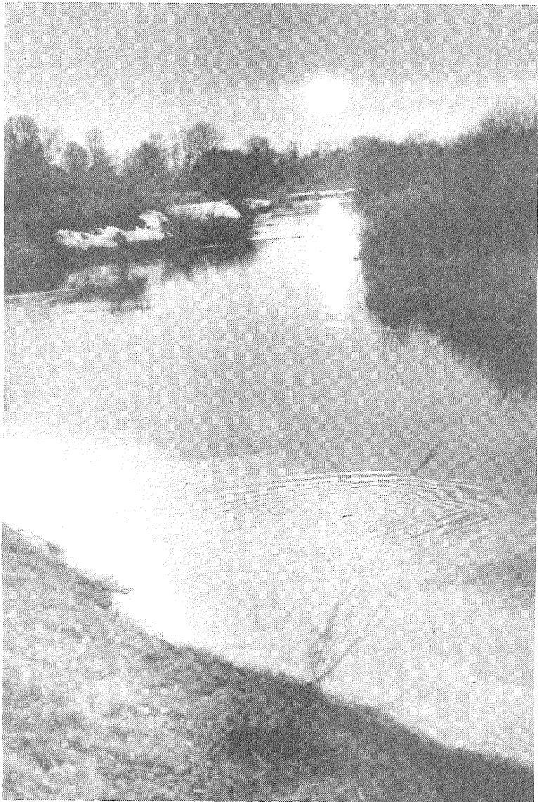
♦ Saules ceļš Dubnā.