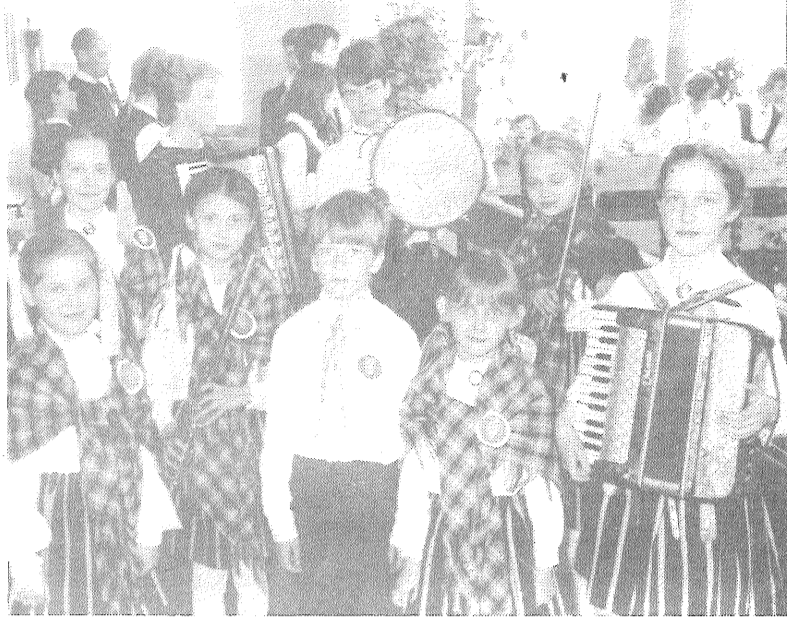
■ Livānu 1. vidusskolas kapela «Dundurinis».