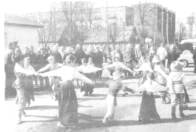
■ Pirms sarīkojuma Jaunsilavās folkloras ansamblis dziedāja un dejoja Livānu ielās un laukumos, kur tika uzņemti ar reakciju visplašākā amplitūdā no — «nav ko darīt» līdz — «šodien taču Jura diena».