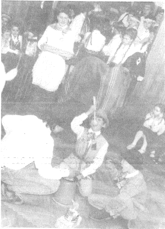
■ Iespējams, ka «zirgus ganības» šogad Jurģu dienā izveda tikai Jaunsilavu skolā. Jo šopavasār līdz 23. aprīlim ne siltums, ne zāles zaļumiņš netika mani.

Kas tur tā pla-tās tūlīt pēc di-rektores nopiel-nā ievadījuma? Pati Juriene. Bet kur tad Juris? Mājās strādā. Kamēr Juriene pestējo pati un māca citiem, kas Jura dienā darāms, — lai zirgiem mugur-as spīdētu, ar skudrām jāno-ber, ja cūka Jur-ģos uz jaunu aizgaldu pār-vesta un negrib tajā apmesties, ar tiem pelniem aizgalds jāizkai-sa, kas pelnu dienā savākti. Ja grib kaimi-ņam ražu no-skaust, tieši šajā dienā kokā jā-kāpj un jā-kliedz: šurp mieži, šurp au-zas. Jura bērni klausās tik rī-