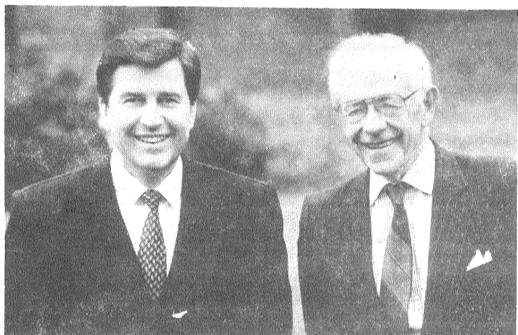
Anatolijs Gorbunovs, Gunārs Meierovics:

Politiskā reklāma – arī laikraksta 2. un 3. lappusē