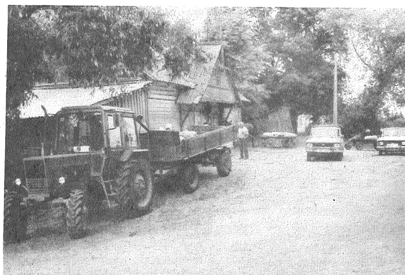
■ Malt gribētu netrūkst, tāpēc pie dzirnavām nereti veidojas pat rinda