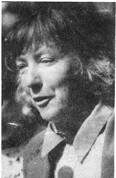
■ Par piemineklja tapšanu stāsta tā autore, māksliniece Vija Dzintare.