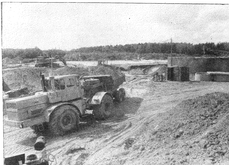
■ Attēlos: top Preiļu attīrīšanas iekārtas.