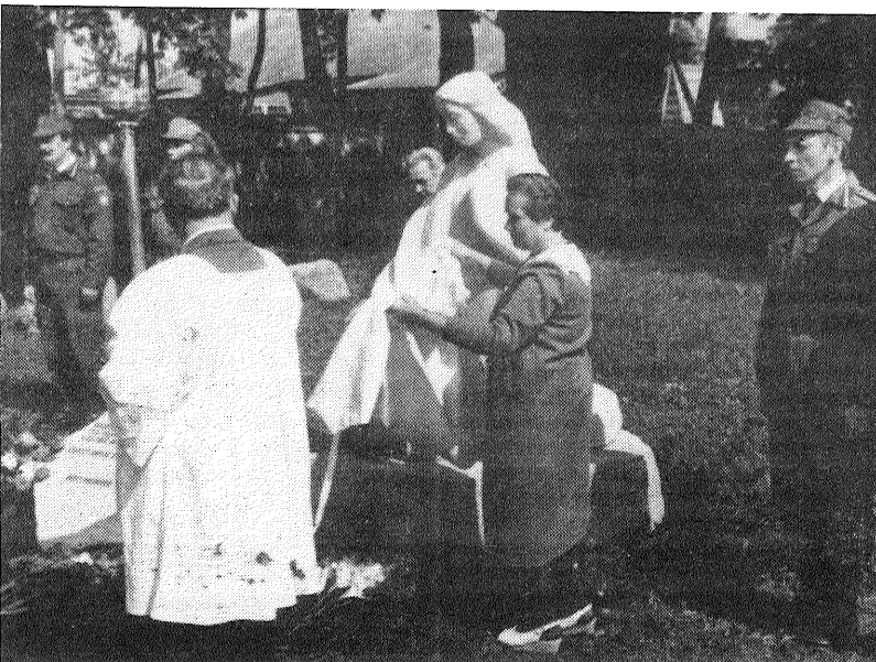
■ Ziedi kā asaras sagūlušī ap gaišo, sērojošo tēlu, piemiņai tiem, kas palikuši tālajos ziemeļos.