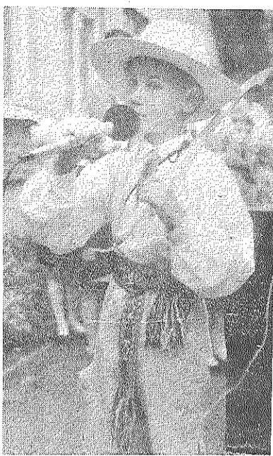
Sprīdītis ieradās Preiļu 1. vidusskolā.