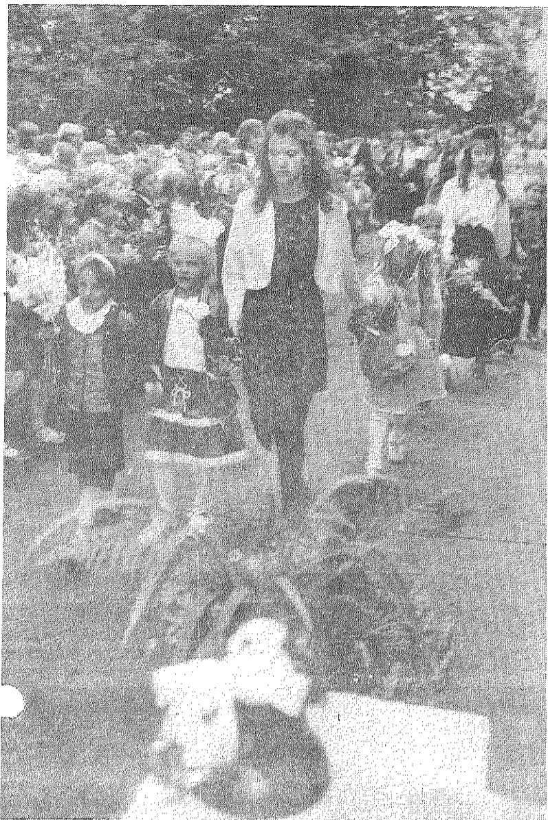
12. klašu skolnieku vadīti ienāk Preiļu 1. vidusskolas pirmgadnieki.