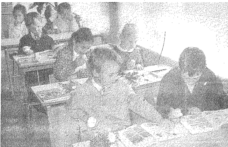
Kad Sprīdiša cienasts rokā, tad var sākt mācīties.

gads sākās Riebiņu vidusskolā. Ar 1. septembri šeit vairs nepastāv 11. klase, jo tajā bija tikai divi audzēkņi. Riebiņu skolas vidusskolas klasēs mācības notiek tikai krievu valodā, un skolu valdē domā, ka, acīmredzot, vidusskola šeit nākamgad nepastāvēs vispār. Jo ne visai tālu — Preiļos ir otra vidusskola. Tiem diviem jauniešiem, kam Riebiņos nebūs 11. klases, jāizvēlas — mācīties Preiļos vai skolu beigt eksterna kārtā. Pedagogiem savukārt iedējādi samazinās darba apjoms.