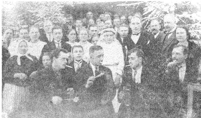
■ Kazas Vidsmuižā (30. gadi).