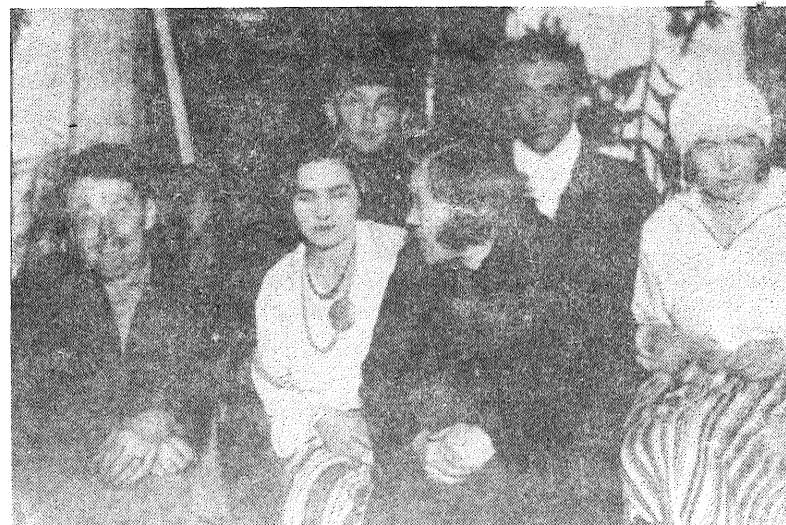
■ 30. gados arī Latgalē spēlēja teatri.