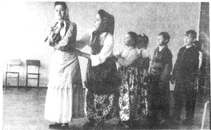
■ «Vecmamiņ, vecmamiņ, dod rutku...»