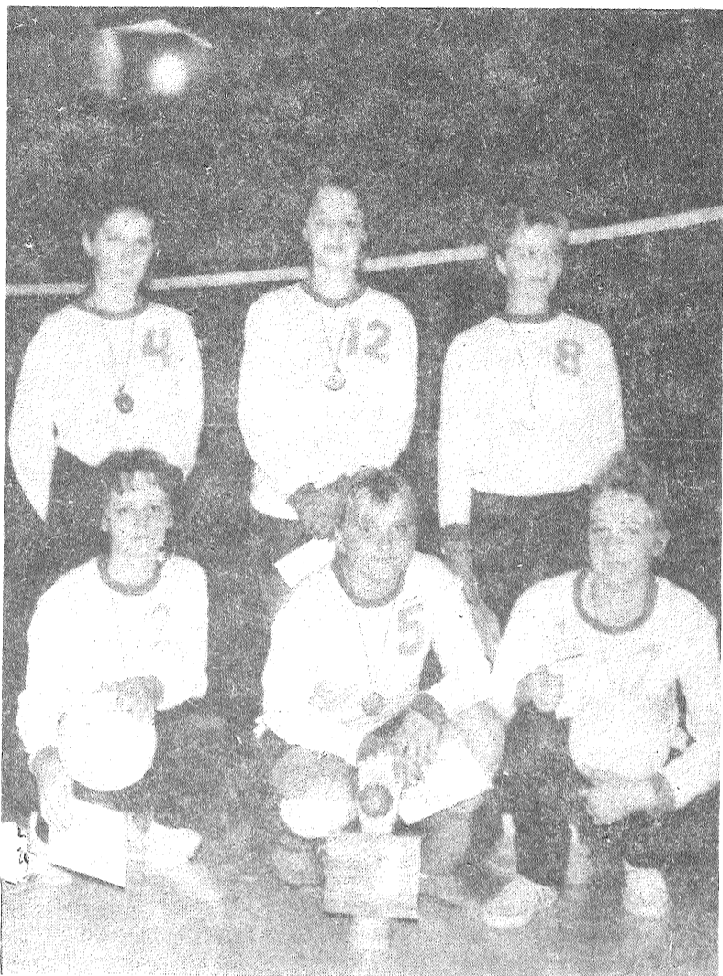
■ Preiļu pilsētas čempiones – sporta kluba «Cerība» volejbolistes.