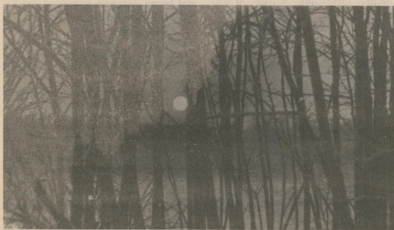
IŠĀ ZIEMAS DIENA IR GALĀ...

— Jā, nomierinoši akvāriji tieši «Sēnītei» visvairāk vajadzīgi, jo tieši te notiek dažāda vardarbība. Pirms kāda laika šajā akvārijiem bagātā iestādījumā tika nošauts redzams noziedznieku pasaules darbonis, bet drīz pēc bārmenes sajūsmas par zelta zivtiņām (16. septembrī) pie «Sēnītes» notika spēcīgs sprādziens, no kura cieta ne tikai slavenais restorāns, bet arī apkārtējie nami un Ģertrūdes baznīca. Un vai gan akvāriju daudzums var būt panaceja pret noziedzību?