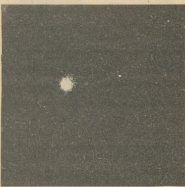
«piefiksējis» cits daugavpīlētis H. Meinerts. Šeit iznākošais laikraksts «Latgales Laiks» paskaidro, ka tie, kuri nepaguva nofotografēt, to var pamēģināt nākamajā reizē — pēc 20 tūkstošiem gadu.