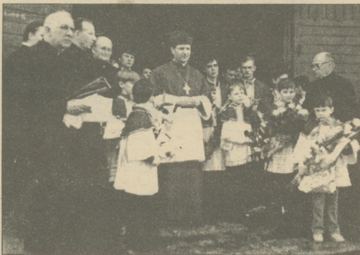
V. E. J. BULIS VIZITĀCIJĀ («KBV»)

garīdzniekiem ar jautājumu: vai viņi grib vēl ciešāk vienoties ar Kungu Jēzu un kļūt Viņam līdzīgi, atteikties no sevis un pildīt pienākumus, kādus uzņēmušies priesterības svētību dienā? Atkal priesteri atbildēja: Es gribu.