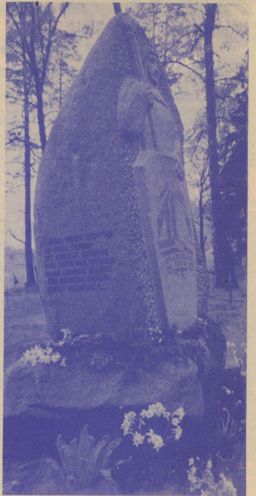
Pieminekļis Pīlciņas kapos