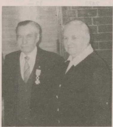
Atāla: roksta autors, L. Rutka un V. Lejņš.

Myužeigu mīru dūd viņam, Kungs, Un myužeiga gaisma lai speid viņam! Nu latviša tautas kūpuma mes asam latgaļu calms. Taidis mes bejom, asam un paliksim naatkareigi nu tō, voi tū kaidis gryb voi nā. Kai mežā pride navar palikt par bāzru un sōkt skuju vitā lopōt, taipat ari mes navarim palikt cyaidi. Kaidis ir myusu ceļš? Ir tikai vīns — myusu augšupejas ceļš. Tys zeimoj: kas mes asam, tys ari paliksim. Tys, kas myusim ir montōts godu symtūs, kas myusim ir svāts un dōrgs, tū mes liksim uz latvišu tautas kūpejō kulturas oltora kai sovu, jo myusu apziņa ir skaidra, jo mes latvišu tautas kūpeibai asam naatvitojami taidi, kaidi asam, tōpēc napaliksim par palovom, lai vēji myus naaizpyuš.