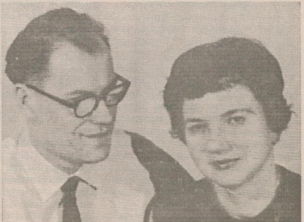
Attālŭs: A. Rubenis 1950. godā Vēntorfā, ar dzeivibŭtri Ilgu sēdasmytajūs godūs Klivlendā.