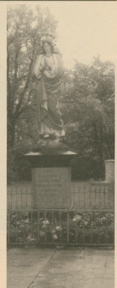
Jaunovas Marijas statuja sv. Ludvika bazneicas dōržā Krōslovā. Par bazneicas vēsturi un piļsātas muzeju nōkamajā numerī.