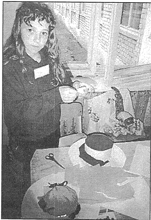
● Nometnes «Krauklēns» mākslas dienā katrs bērns varēja ļaut vaļu savai radošajai fantāzijai.

Nometne bērniem patika. Katru vakaru viņi rakstīja vēstulītes eņģelītim un tad atklājās, kas dienā piedzīvots jauks, kas sāpinājis. Lielākoties — ilgas pēc mā-