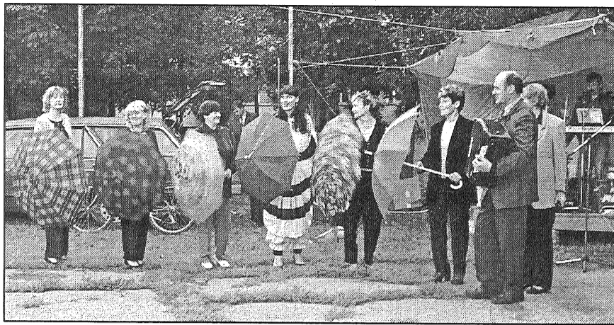
● Uzstājas Celtnieku ielas «Dāmu pops».