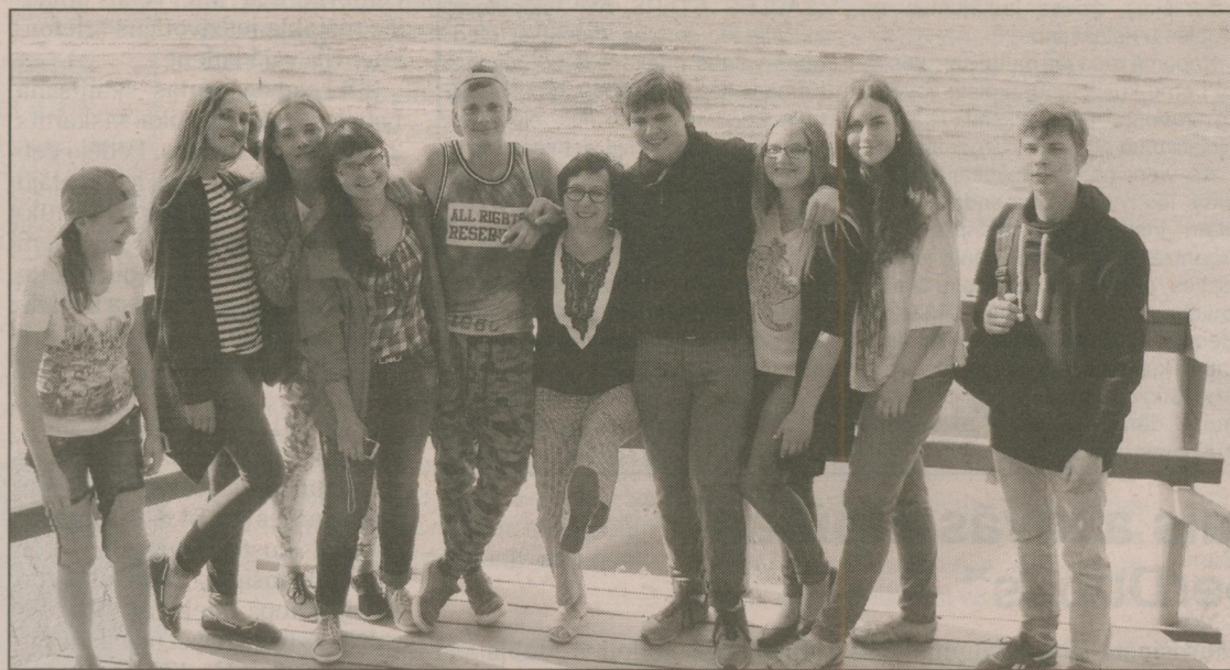
● Teātra grupa „Kājām gaisā” pie jūras.

— tas viss izjūst Cēsis. Būdami Āraišu ezerpilī, pārlicinājāmies, ka mūsdienu cilvēks ir vārda tiešākajā nozīmē audzis savā attīstībā, jo mājiņu izmēri liecina par maza auguma iemītniekiem. Un radās domas par brīvdabas izrādi tautas tērpos, pārvēršot Āraišu ezerpils mājiņas par sava veida skatuvi.