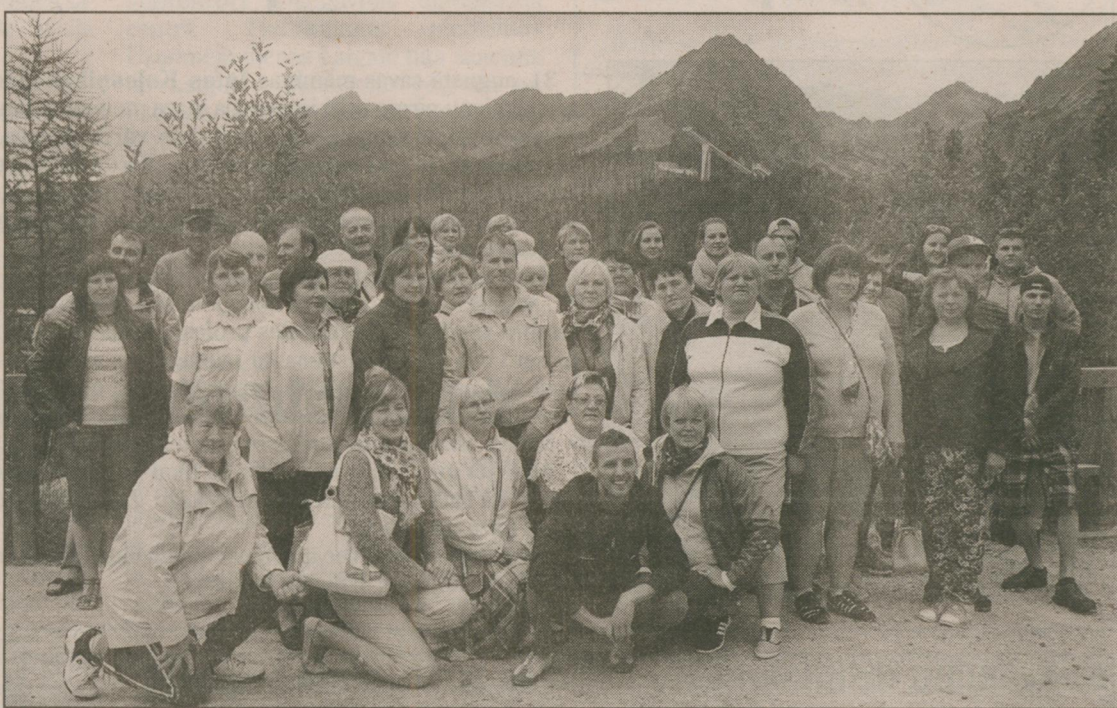
● Vārkavas novada pašdarbnieki Slovākijā.

Uzstāties vajadzēja pilsētā Liptovsky Mikulaš. Vairāk nekā