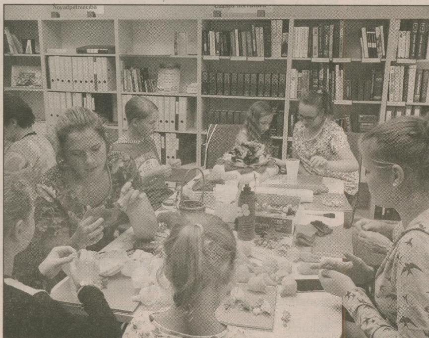
● Radošās darbnīcas dalībnieki aktīvi un pacietīgi veido konfekšu ziedus.