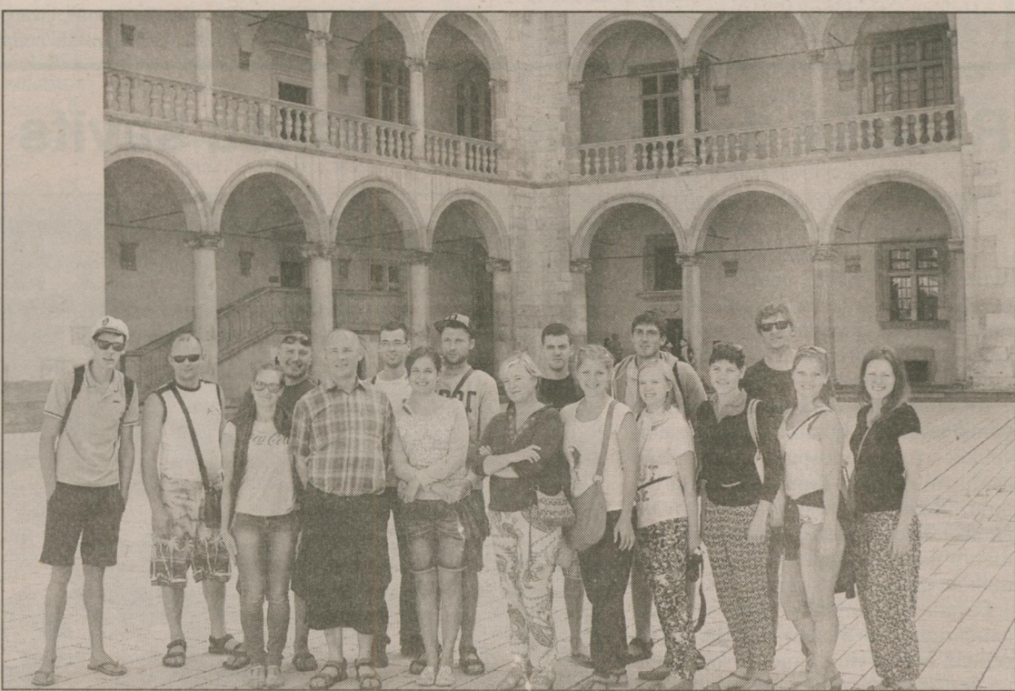
● Pa ceļam uz festivāla norises vietu Stabulnieku deju kolektīvs apmeklēja vienu no Polijas skaistākajām pilsētām – Krakovu.

Kā jau tas ierasti starptautiskos deju festivālos, tad deju kolektīvus pavada dzīvā mūzika – ansamblī un lauku kapelas. Veiksmīgā sadarbība un jauks skaņējums deju festivālā „Szent Istvan” Rumānijā Stabulnieku deju kolektīvam bija kopā ar Viļānu